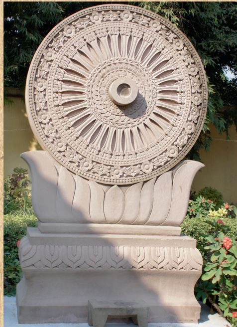
Колесо Дхармы. Китайский монастырь, Сарнатх, Индия. 2015.

О буддизме в Индии написаны десятки тысяч книг, а пути современного паломника, обычно распо-