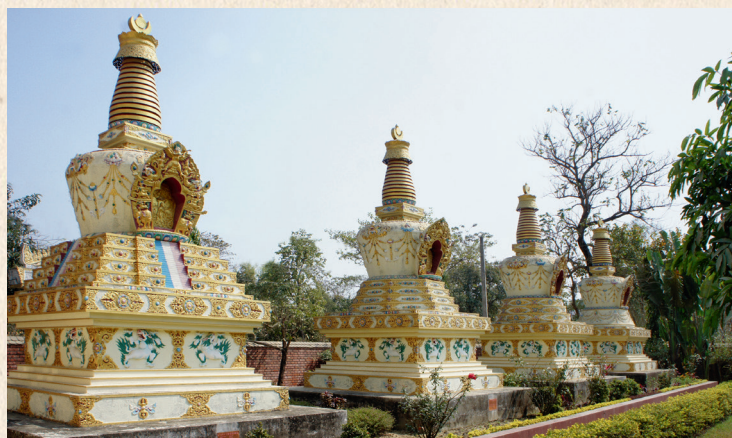
Ступы Нисхождения с небес, Единения, Победы и Лotosовая в монастыре Карма Самтенлинг, Лумбини, Непал. 2023.

В сутре «Великая Нирвана» Будда рекомендует своим ученикам посещать четыре места, связанные с главными событиями возникновения буддизма: где родился Татхагата (Лумбини, ныне в Непале); где он достиг Пробуждения (Бодхгая, штат Бихар); где впервые «повернул колесо Учения» (Сарнатх близ Варанаси, штат Уттар); и место, где Шакьямуни ушел из нашего мира (Кушинагара, Уттар). «И кто, Ананда, умрет во время такого паломничества с сердцем, исполненным веры, по разрушении этого тела обретет существование на высших уровнях!»