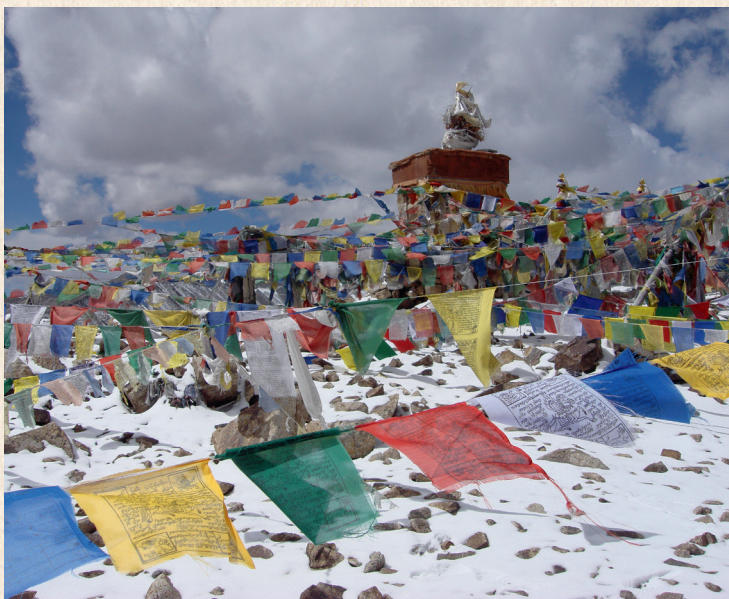
Украшенный молитвенными флагами перевал Ххардонг (5360 м), Ладакх, Индия. 2010.