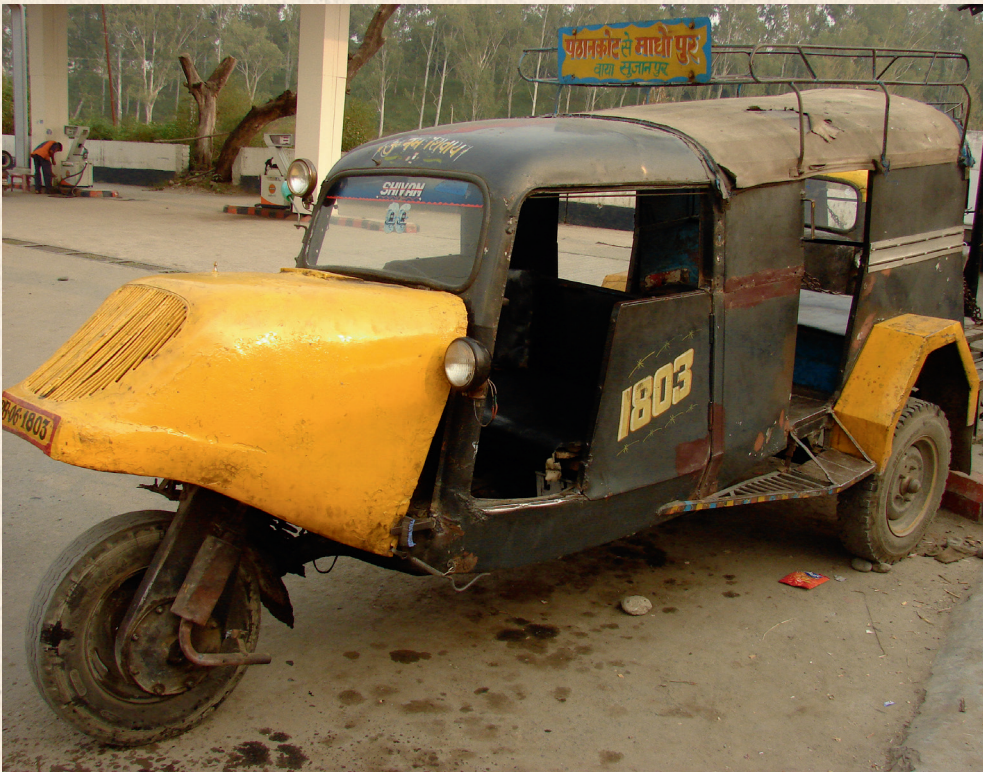
Такси в Шринагаре, Кашмир, Индия. 2008.