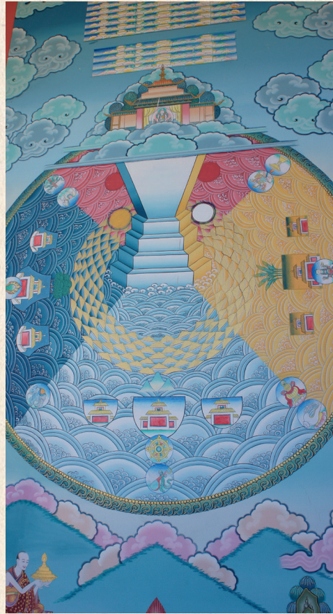
Мир в представлении древних индийцев. Фреска в монастыре Нала, долина Катманду, Непал. 2016

Первые города цивилизации долины Инда (Хараппской) возникли около 3200 лет до н. э., и расцвет этой земледельческой, лишенной военных амбиций культуры пришелся на 2500-1800 гг. до н. э. Торговля, наземная и морская, активнее всего происходила с государствами Месопотамии, где было найдено много следов этих связей.