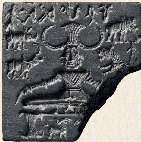
* Прото-Шива на печати из Мохенджо-Даро. Середина 3-го тыс. до н. э. Национальный музей, Дели. 2012.