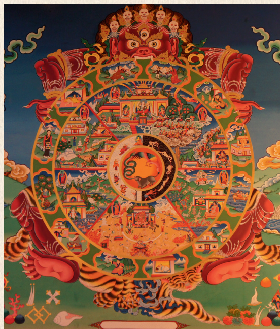
Колесо сансары. Фреска в монастыре Ньингма, Калимпонг, Западная Бенгалия. 2013.

Буддийский взгляд на историю. Сансара – обусловленное существование, то, что мы называем нашим миром, – известна своей беспредельностью и безначальностью. «Малые» кальпы – периоды, длящиеся миллиарды лет, образуют «неизмеримые» кальпы , а те, в свою очередь, сменяют друг друга в непостижимой обыденным разумом последовательности. И все это время мы из-за незнания собственной сущности скитаемся и страдаем, переселяясь из тела в тело, в бесчисленных мирах и сферах.