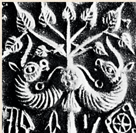
* Листья дерева Бодхи на печати из Мохенджо-Даро. Середина 3-го тыс. до н. э. Национальный музей, Дели. 2012.

Индоарийские племена появились в бассейне Инда с Иранского нагорья в середине II тысячелетия до н. э. До III тысячелетия до н. э. их предки обитали на обширной степной территории бассейнов Волги и Кубани и до 2500 г. до н. э. говорили на протоиндоевропейском языке. Предки индоиранцев располагали лучшими