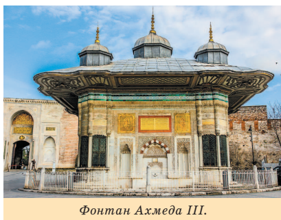
Фонтан Ахмеда III.