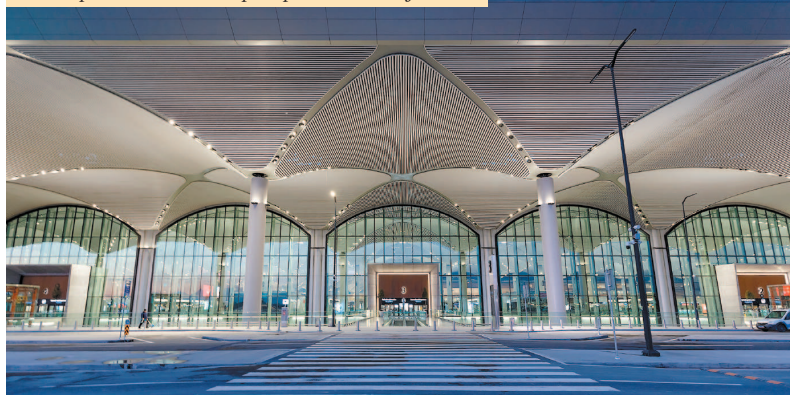
Терминал Нового аэропорта в Стамбуле.

Компактное расположение главных достопримечательностей Стамбула позволяет обойти их пешком. Но чтобы добраться до не менее привлекательных памятников истории и архитектуры, которые находятся в отдаленных от центра районах, предстоит освоить различные виды городского транспорта. Перемещать-