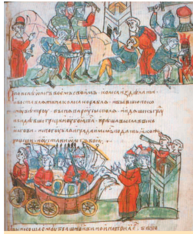
Поход Олега на Царьград. Миниатюра из Радзивилловской летописи. XV в.

Наибольшего расцвета Византия достигла в VI в. во времена правления Юстиниана. При нем в столице были