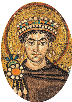
Юстиниан I. Мозаика в церкви Сан-Витале в Равенне, Италия.

Помимо руссов виды на Константинополь имели арабы. Но самое удивительное, что на оплот христианства в 1204 г.