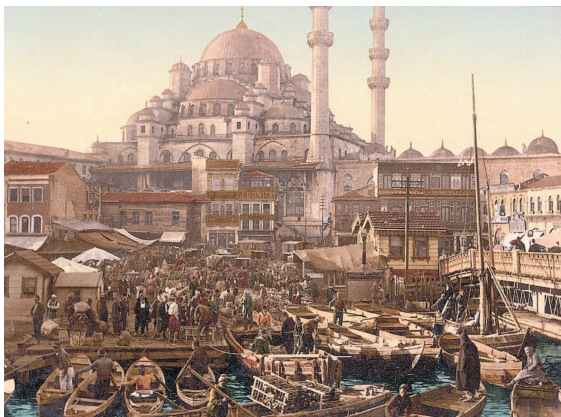
Базар на площади Эминеню и Новая мечеть. Фото 1890–1900 гг.