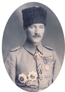
Мустафа Кемаль Ататюрк – первый президент Турецкой Республики, основатель современного турецкого государства.

Ситуация еще больше усугубилась после участия государства в Первой мировой войне, которое привело к оккупации страны силами Антанты. Но национально-патриотические силы во главе с Мустафой Кемалем восстали против иностранной интервенции и, изгнав непрошенных гостей, создали независимую Турецкую Республику. Новому государству нужна была новая столица. Мустафа Кемаль Ататюрк объявил таковой Анкару, а Константинополь в 1930 г. официально переименовали в Стамбул. Несмотря на потерю столичного статуса, город продолжает оставаться торгово-промышленным, коммерческим, культурным, а также туристическим центром страны.