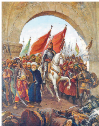
Фаусто Зонаро. Вступление Мехмеда II в Константинополь.

Тем временем на востоке все ближе к Византийской империи подби-