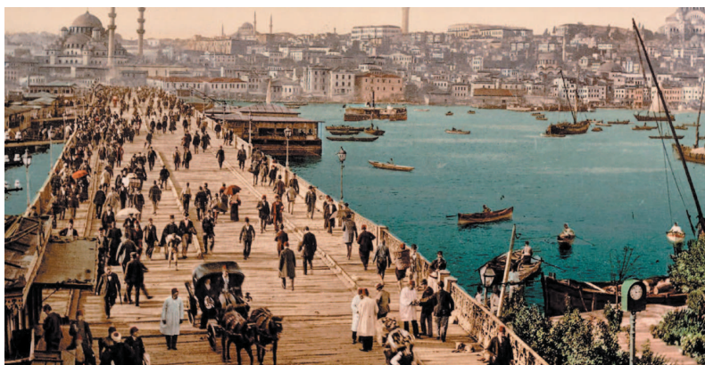
Галатский мост, фото конца XIX в.

посягнули сами христиане. Впервые в своей истории город пал под натиском крестоносцев. Результатом Четвертого крестового похода стало не только разграбление города. Вся Византия была поделена на несколько царств. Константинополь же вошел в созданную крестоносцами Латинскую империю, которая просуществовала всего 57 лет.