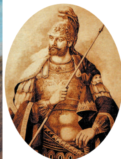
Константин XI Палеолог – последний правитель Византийской империи. Рисунок XIX в.