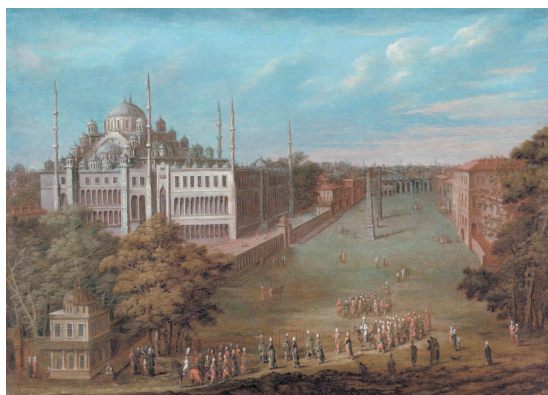
Великий визирь пересекает площадь Атмейданы. Ж. Б. ван Мур, первая половина XVIII в.

За шесть лет город подняли практически из руин. Константин не жалел на его возведение ни средств, ни указов. В Византий прибывали лучшие мастера