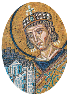
Константин Великий приносит Новый Рим в дар Богородице. Мозаика над входом в собор Святой Софии.