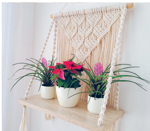
ПАННО С ПОЛОЧКОЙ ДЛЯ ЦВЕТОВ