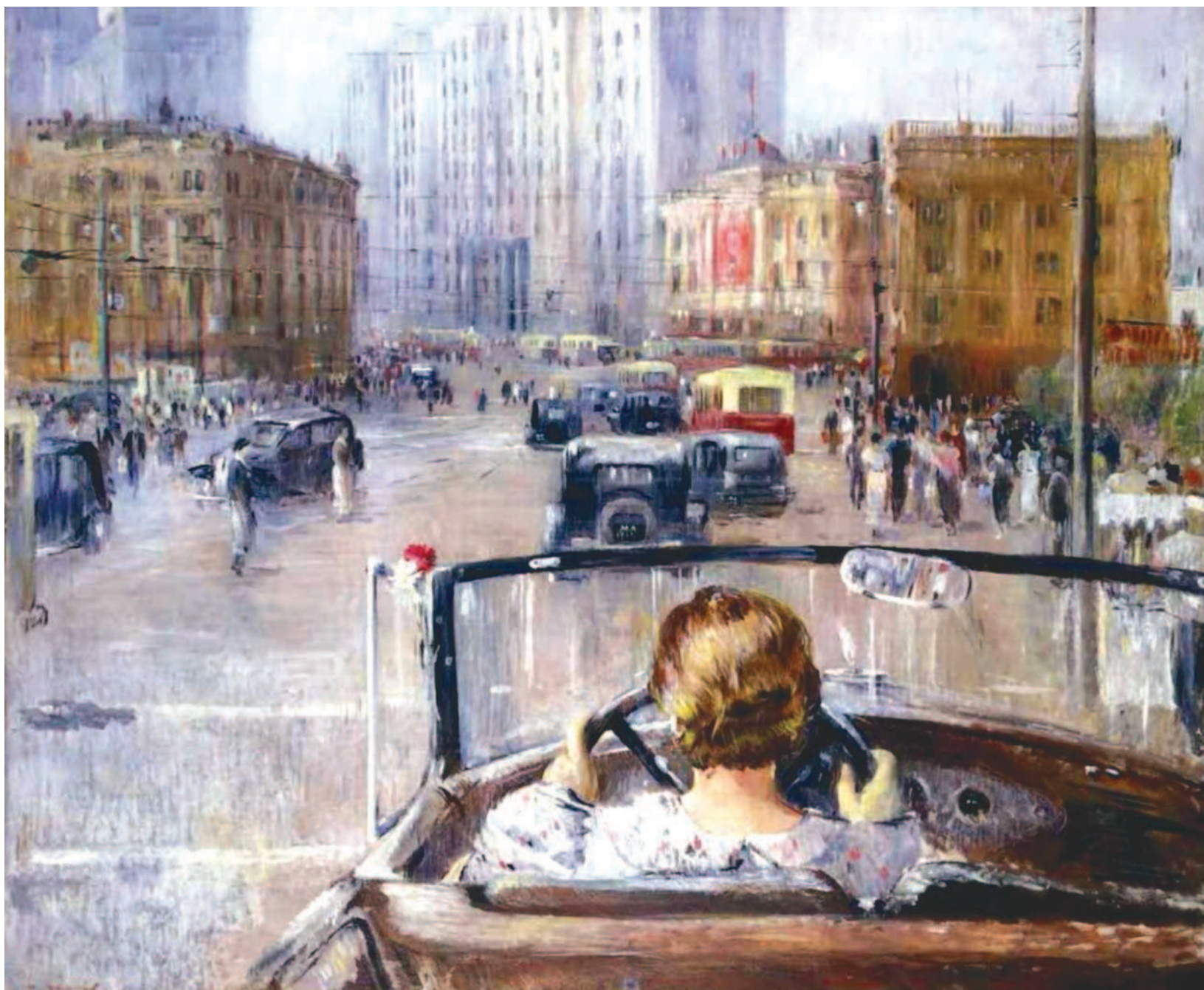
Новая Москва. Художник Ю. Пименов