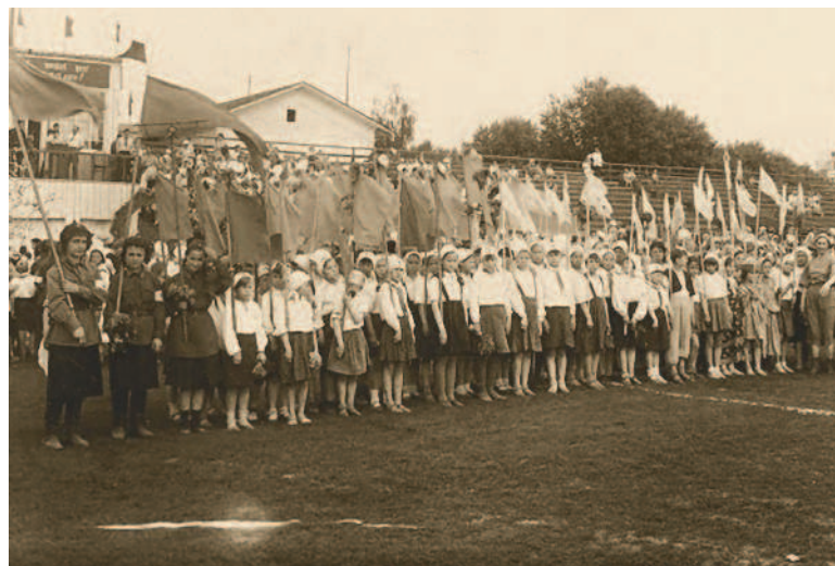
Дети во время традиционного праздника, посвященного окончанию учебного года.

Фашистские разбойники напали на нашу Родину... Но не первый раз приходится русскому народу выдерживать такие испытания. С Божией помощью и на сей раз он развеет в прах фашистскую вражескую силу. Митрополит Московский и Коломенский Сергей