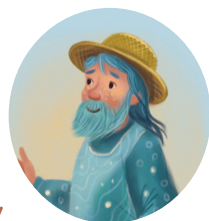
Хозяин моря Яру