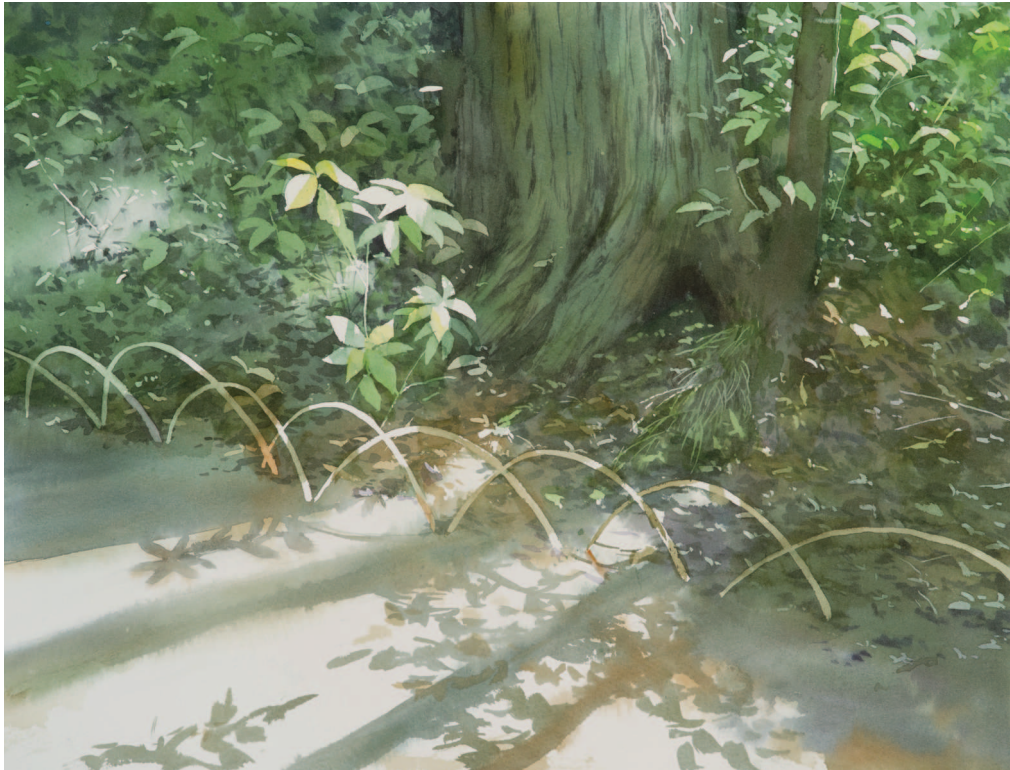
■ СВЕТ НА ТРОПЕ 29,0 × 39,0 см