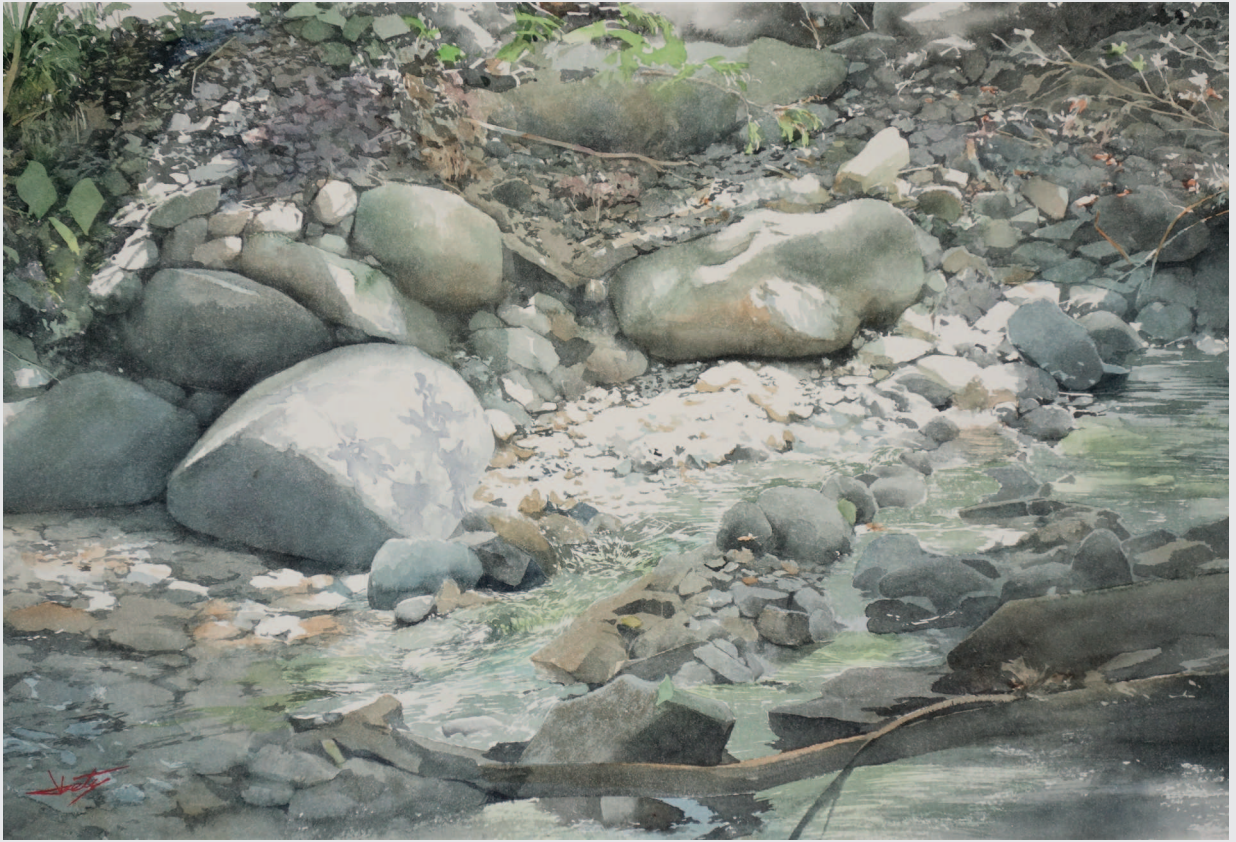
КАМНИ И ВОДА