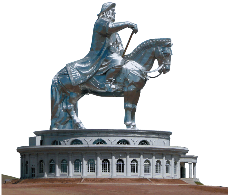
40-метровая конная статуя Чингисхана на берегу реки Туул. Монголия. Цонжин-Болдог

В Цонжин-Болдоге (Монголия) в 2008 г. открылся мемориал, посвященный Чингисхану. Центром его является конная статуя Чингисхана, вокруг которой разбит тематический парк, который представляет посетителям все стороны монгольской жизни XIII в.