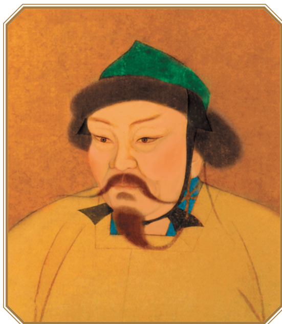
Угэдэй, третий сын Чингисхана и его официальный наследник.