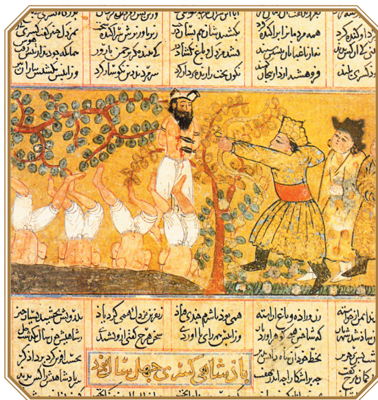
Монголы казнят пленных.