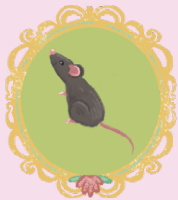
УДИВЛЁННУЮ СЕРУЮ МЫШКУ