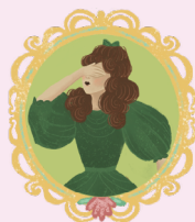
РАССТРОЕННУЮ СВОДНУЮ СЕСТРУ