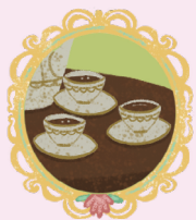
ТРИ КОФЕЙНЫЕ ЧАШКИ