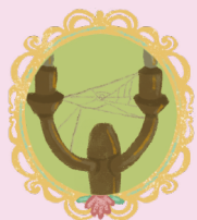
ПАУТИНКУ НА ПОДСВЕЧНИКЕ