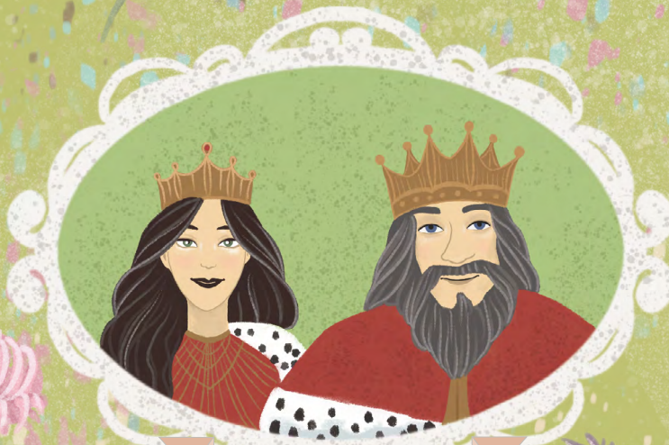
КОРОЛЬ И КОРОЛЕВА