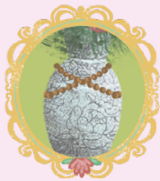
УКРАШЕНИЕ НА ВАЗЕ