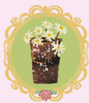
ДВЕ ВАЗЫ С РОМАШКАМИ