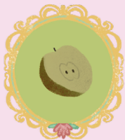
ТРИ ЯБЛОЧНЫЕ ПОЛОВИНКИ