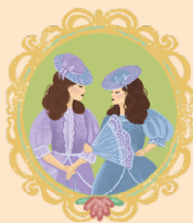
ДУХ СВОДНЫХ СЕСТЁР