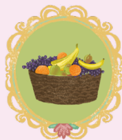
КОРЗИНКУ С ФРУКТАМИ