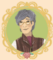
ОТЦА ЗОЛУШКИ В ОЧКАХ