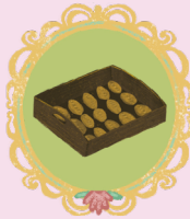
ПРОТИВЕНЬ С ПИРОЖКАМИ