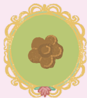
ЧЕТЫРЕ БРОНЗОВЫЕ РОЗОЧКИ