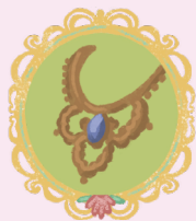
ОЖЕРЕЛЬЕ С ГОЛУБЫМ КАМНЕМ