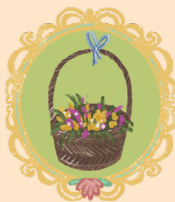
КОРЗИНКУ С ЦВЕТАМИ