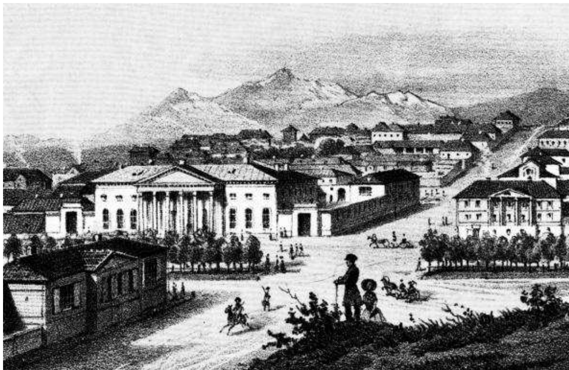
Вид Пятигорска Гравюра 1840-х гг.