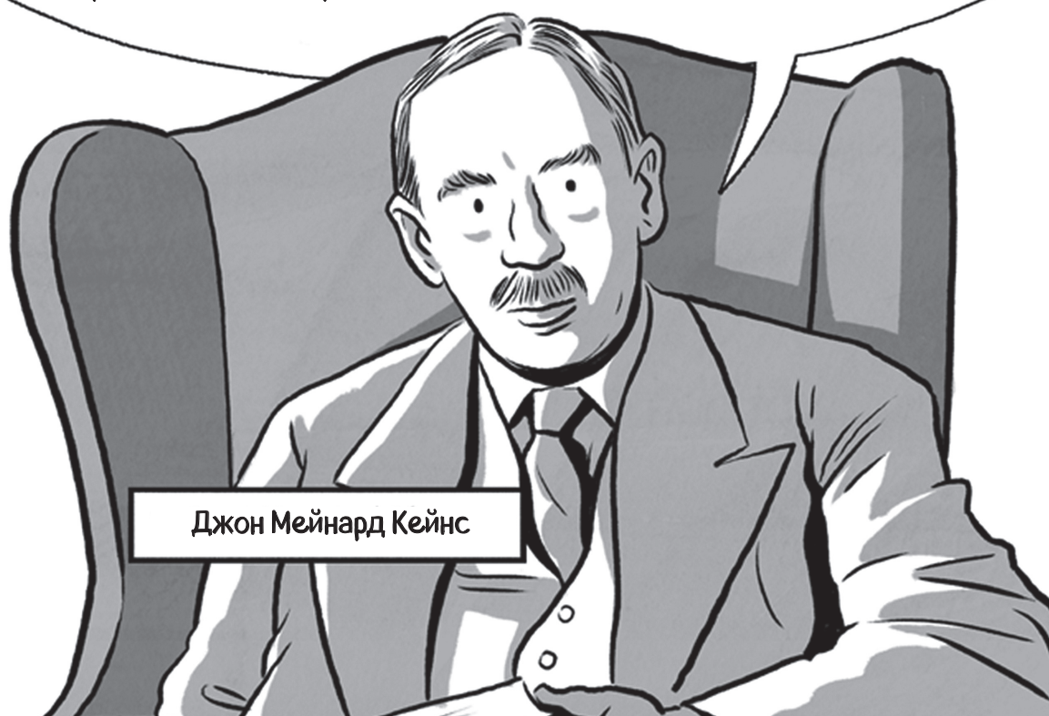
Джон Мейнард Кейнс

Суть тут не в выборе тех, кто по чьему-то определению самые красивые, и не в выборе тех, кто, по среднестатистическому мнению, самые красивые. Мы исследуем свою рассудительность, определяя, каким должно быть среднестатистическое мнение, основываясь на предположениях среднестатистического мнения об этом.