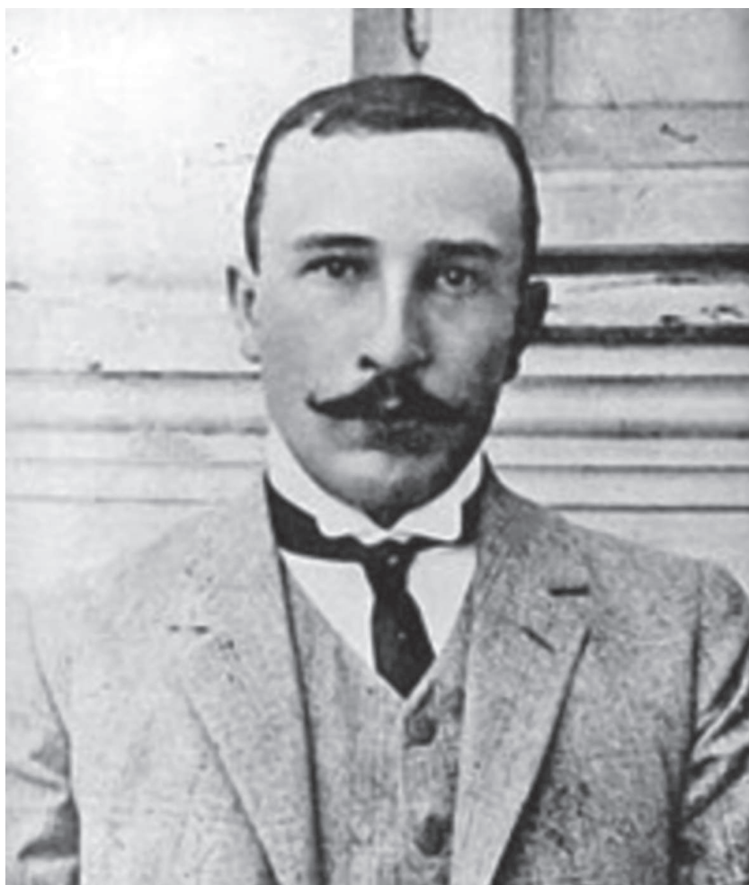
Борис Викторович Савинков (1879 — 1925) — российский революционер, террорист, один из лидеров партии эсеров, руководитель Боевой организации партии эсеров. Участник Белого движения, писатель (прозаик, поэт, публицист, мемуарист; литературный псевдоним — В. Ропшин).