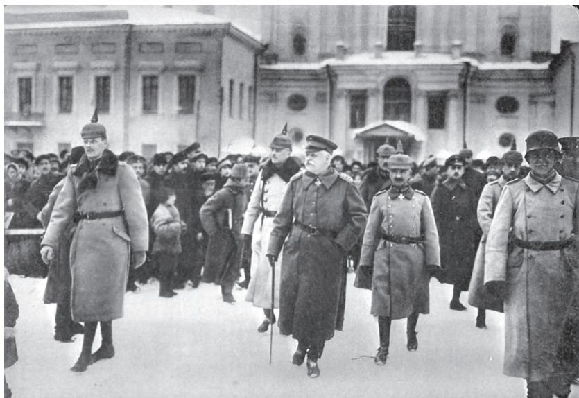
Прибытие немецкой делегации в Брест-Литовск