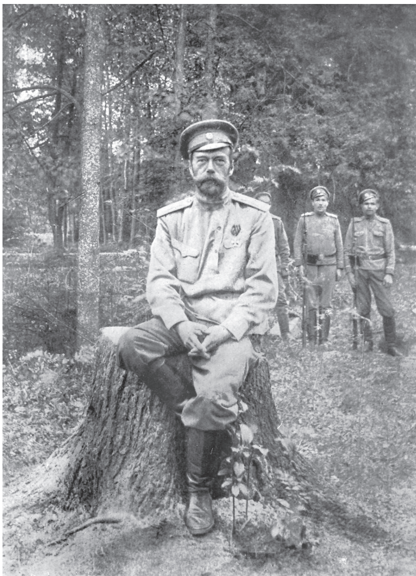
Фотография Николая Романова (1868-1918), сделанная после его отречения в 1917 году в Царском Селе