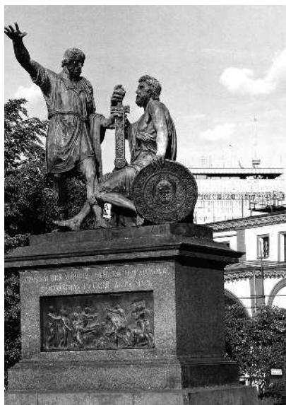
Рис. 3. Памятник Минину и Пожарскому на Красной Площади в Москве. Поставлен в 1818 году. Взято из [549].

Итак, получается, что известный монумент Минина и Пожарского на Красной площади в Москве является памятником ветхозаветным ордынским героям Неемии и Шешбацару, жившим в конце XVI—XVII веке, рис. 3. На рис. 4 приведена ста-