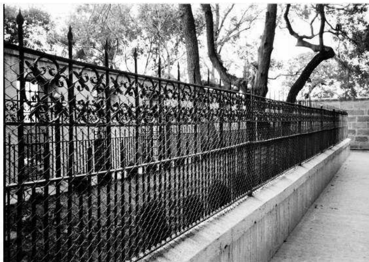
Рис. 1. Символическая могила «святого Иисуса» на Бейкосе. Фотография 1995 года.

вольно пустынной местности Ближнего Востока из небольшого арабского поселения Эль-Кудс не ранее XVIII или даже XIX века. Объявлен центром поклонения. Никакого отношения к евангельским событиям не имеет. Фальсификаторы XVII—XIX веков преследовали четкую цель: перенести — на бумаге! — евангельские события далеко в сторону от настоящего Иерусалима = Царь-Града, дабы погрузить в забвение важную часть подлинной истории.