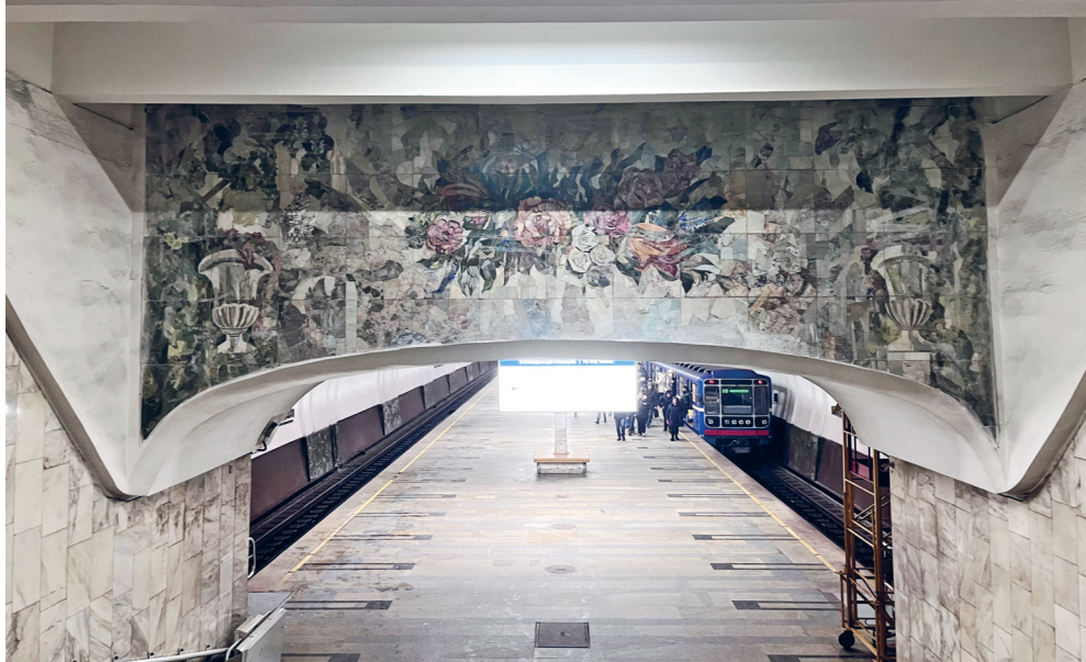
Станция метро «Парк культуры»