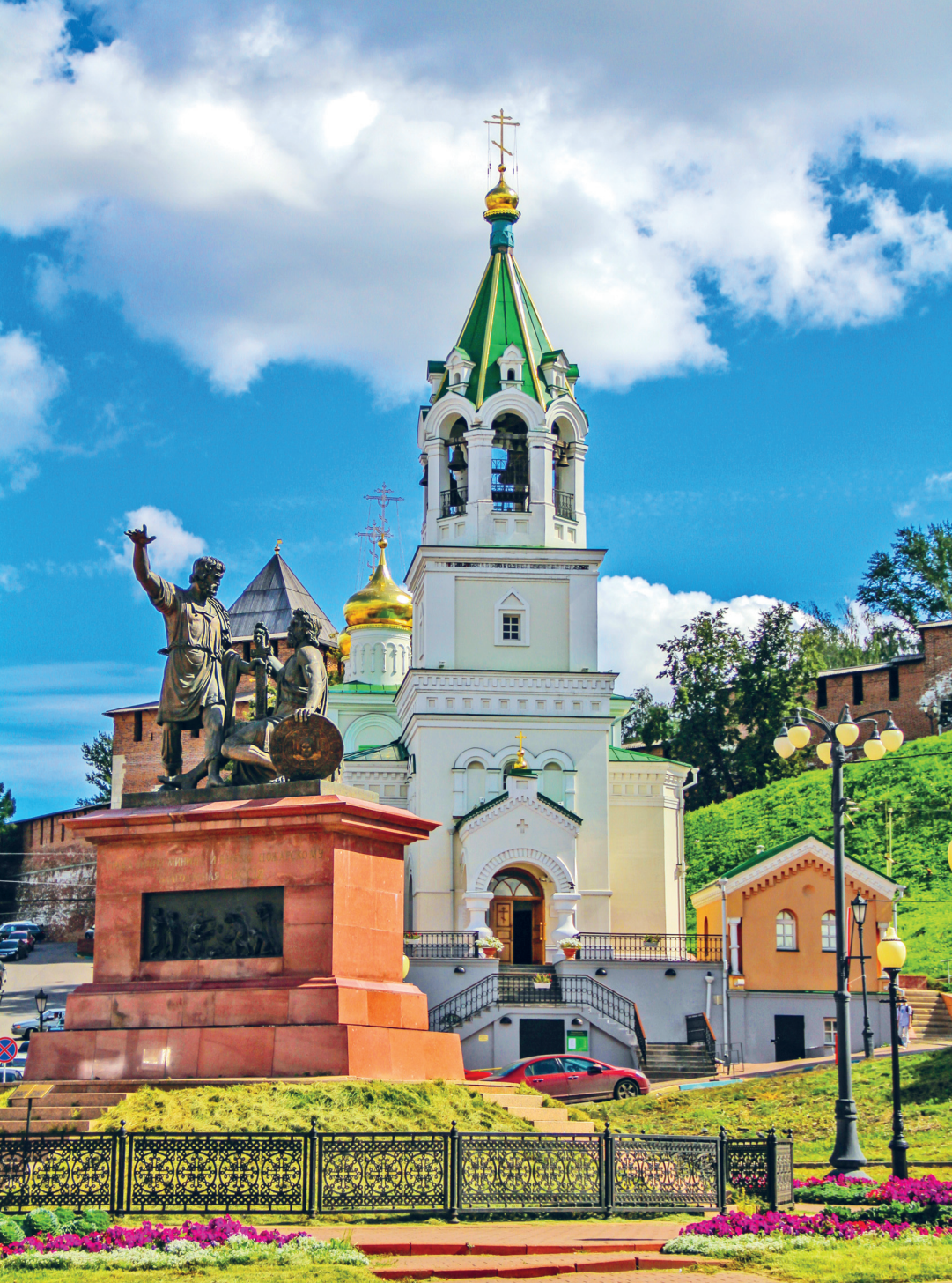
Памятник Минину и Пожарскому и церковь Иоанна Предтечи