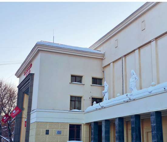
Здание кинотеатра «Мир»

Соцгород — это настоящий музей конструктивизма под открытым небом. Мы увидели лишь малую часть: улицы, парк, дома, которые помнят энтузиазм и мечты тех, кто их строил. Теперь пришло время спуститься в метро и продолжить наше путешествие.