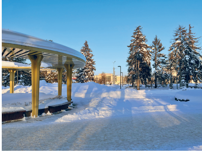
На площади Киселева

и дойти до конца ограды. Здесь вы окажетесь на 7 ПЛОЩАДИ КИСЕЛЕВА — главной площади Автозаводского района.