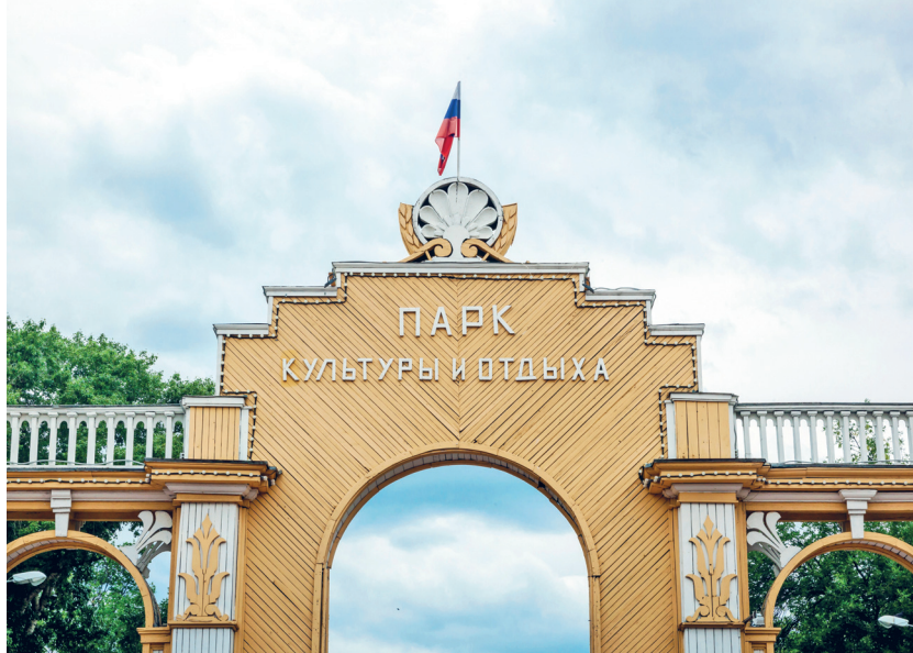
Центральные ворота Автозаводского парка

кварталами и духом советской эпохи. Тогда строился новый мир и формировалась другая реальность — город Горький.