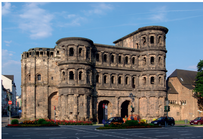
Рис. 6. Порта-Нигра . 170 г. Трир, Германия.

(лат. Porta Nigra — черные ворота). Они находятся в городе Трир (рис. 6) и считаются самыми большими и хорошо сохранившимися среди всех античных ворот. До недавнего времени возраст этого объекта определялся примерно, промежуток составлял около двухсот лет. Но не так давно в ходе раскопок недалеко от ворот была обнаружена древесина, которую использовали при их строительстве. Ее анализ показал, что это дерево (дуб) было срублено зимой 169–170 годов нашей эры. Так как такой материал обычно не хранили долго, то можно предположить, что древесину почти сразу использовали.