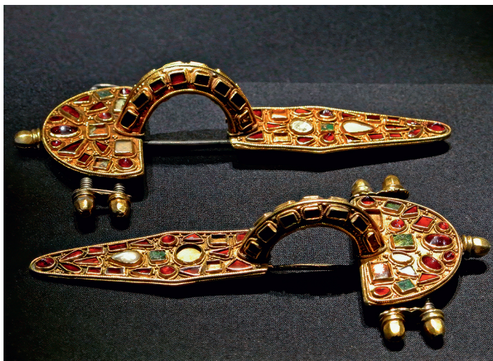
Рис. 4. Готская фибула. Полихромный стиль. V в.

стекло и эмаль и также добавляли золотые перегородки. Предметы, сделанные в полихромном стиле готами, находят даже в Восточной Европе. Отдельно стоит выделить S-образные металлические застёжки с замком — так называемые фибулы со звериными или птичьими головками (рис. 4). Тогда они имели практическую функцию — закрепить одеяние. Сейчас фибулы — украшения для одежды, распространенные повсеместно. Параллельно полихромии в германских племенах начали изготавливать металлические украшения с выдавленными клинообразными фигурами.