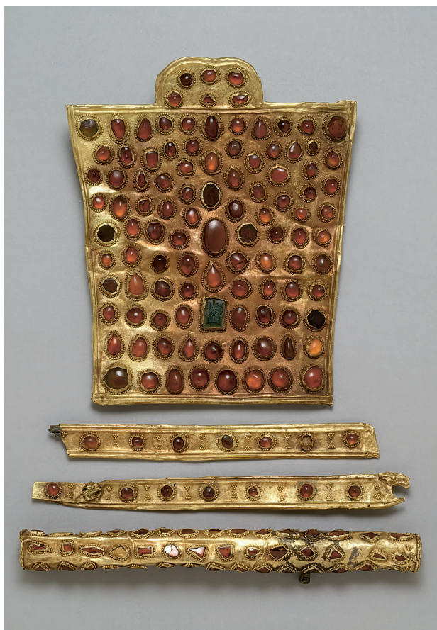
Рис. 3. Височное украшение. Полихромный стиль. Золото, драгоценные камни. V в.