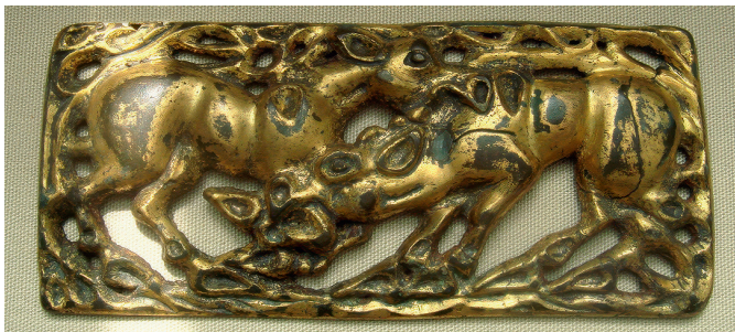
Рис. 5. Пряжка. Скифо-сибирский звериный стиль. Золото. V–IV вв. до н.э.

К середине VI века изделия из металла, а именно из железа, начали занимать господствующие позиции. Особенно стоит выделить так называемый звериный стиль (рис. 5). К этому моменту орнаменты усложнились, а темой работ стали фантастические изображения животных. Стоит отметить, что германские мастера создавали такие произведения искусства, что среди орнаментальных витиеватых линий и фигур сложно распознать образы самих животных. Этот стиль восходит к скифо-сибирскому «звериному стилю», который был распространен еще в VII–III веках до нашей эры на территории Северной Евразии. Некоторые ученые полагают, что популяризация изображения зверей произошла из-за появления тотемных животных. В отдельных случаях на изделиях такого стиля изображались отдельные части звериных тел, которые являлись символами определенных животных.