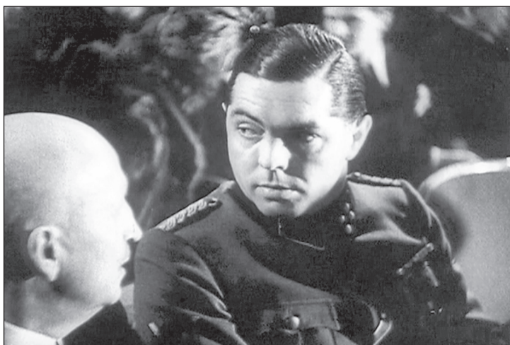
На заседании Имперской кинопалаты. Штурмбаннфюрер СС Фриц Гипплер – постановщик пропагандистского фильма «Вечный Жид»

шимый бастион арийской расы на одном полюсе, а на другом находятся иудеи, евреи, чье «паразитическое и дегенеративное» влияние грозит похоронить цивилизацию. Германского превосходства можно было достичь сначала устранением внутренних политических противников и затем в решающей битве сокрушить державы-победительницы в Первой мировой войне. Для того чтобы в полной мере развернуть потенциал, германским арийцам необходимо расширить границы рейха на восток, обрести « Lebensraum » (жизненное пространство). Дальнейшей целью является создание германской империи с границами от Урала до Гибралтара, свободной от евреев, славян и прочих « Untermenschen » («недочеловеков»).