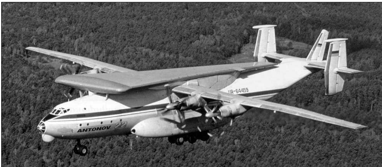
Транспортировка консоли крыла Ан-124 на фюзеляже самолета Ан-22

обширную программу испытаний и доводки двигателя, сохранился один из главных его недостатков — недостаточная газодинамическая устойчивость, иногда приводившая к помпажным явлениям. Забегая вперед, напомним, что один такой случай впервые получил мировую огласку в сентябре 1988 года во время работы очередного авиационно-космического салона в Фарнборо. В день открытия выставки во время разбега, когда скорость достигла 120 км/ч, экипаж прекратил взлет из-за возникшей тряски одного из двигателей. Пришлось срочно доставлять из Киева новый ТРДД и лишь после его замены продолжить полеты. Надо сказать, что помпажные явления в двигателях не были редкостью. Например, подобное случилось в ходе государственных испытаний, когда «Руслан» находился в районе Северного полюса.