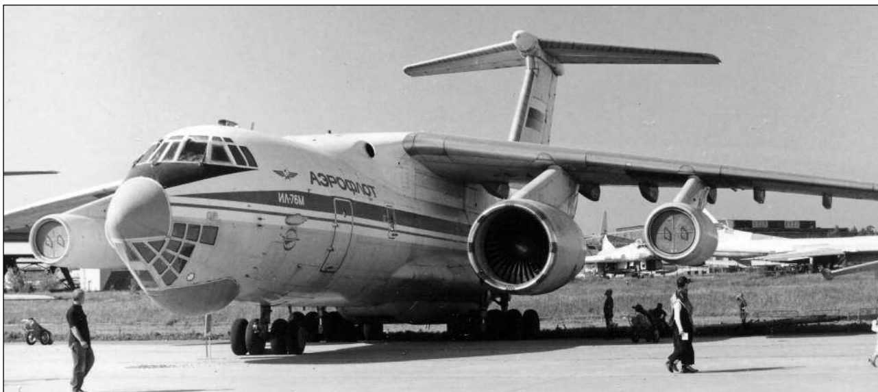
Летающая лаборатория Ил-76ЛЛ для испытаний двигателя Д-18Т

Летные испытания и доводка двигателя Д-18Т проводились в ЛИИ на летающей лаборатории Ил-76 параллельно с испытаниями «Руслана». Несмотря на