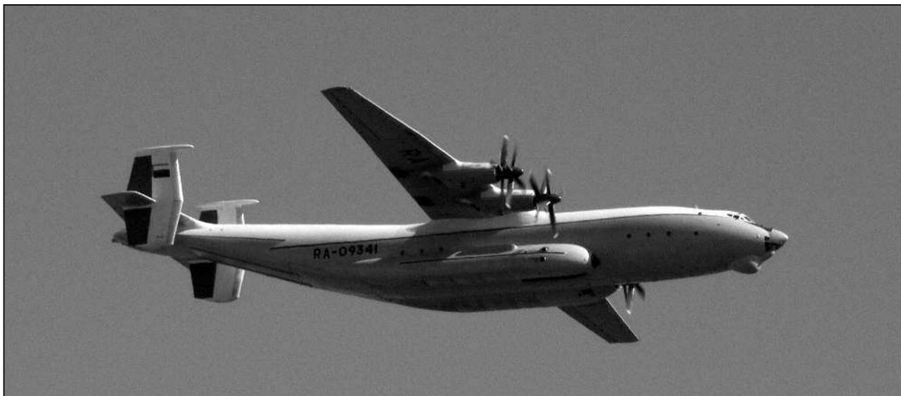
Предшественник «Руслана» самолет «Антей»

в пику свой аналог. Ведь за океаном работают не дураки. Любопытно, но такие мысли вслух посещали и других наших «специалистов».