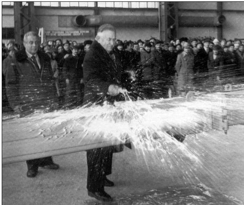
О. К. Антонов разбивает бутылку шампанского о водило перед выкаткой первого экземпляра Ан-124 из сборочного цеха завода

Мое рабочее место в самолете находилось в настоящей железной будке без окон, с искусственным освещением. Я сидел, привязанный к креслу, на ранце с парашютом и в защитном шлеме, среди кнопок и тумблеров. Разговаривать с экипажем мог только по самолетному переговорному устройству. Вентиляция была еще не отработана, окружающая меня аппаратура нагрелась, и я сидел, словно в жаровой камере, обливаясь потом. Двигатели были еще недоработаны, для их смазки применили опытное син-