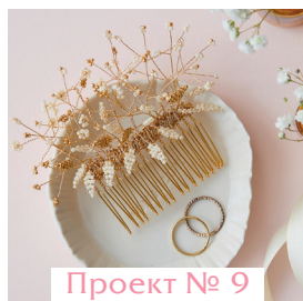
Проект № 9