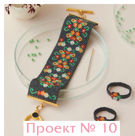
Проект № 10

Браслет и кольцо «Польские» @etoiles_pistache