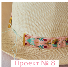
Проект № 8