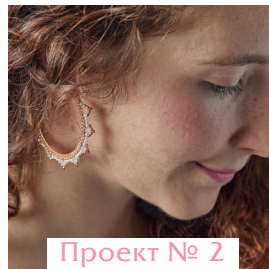
Проект № 2