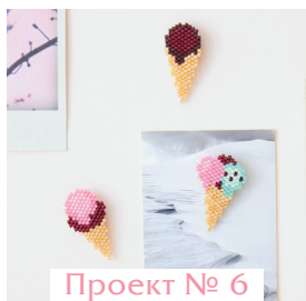
Проект № 6