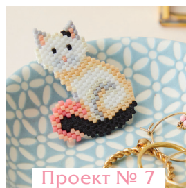
Проект № 7

Маленький котик Ноэ @lesptitsbonheursdemamzellelulu