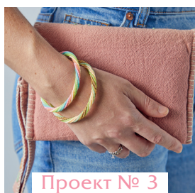
Проект № 3