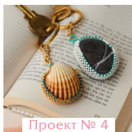
Проект № 4