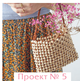
Проект № 5