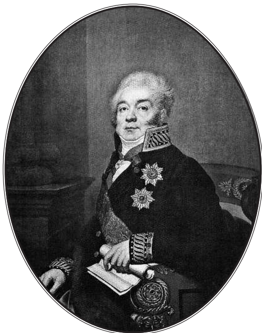
Дмитрий Александрович Гурьев (1751—1825)