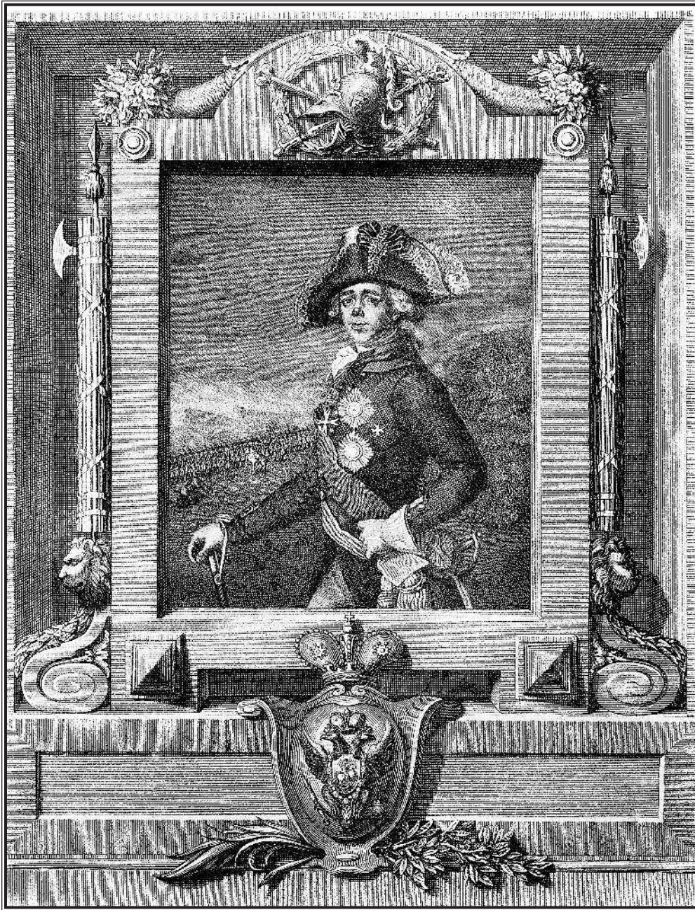
Соломон Карделли. Самодержец и император Всероссийский Российский Павел I. 1797 г.

Репутация Аракчеева была так ужасна, ненависть к нему — так велика, что «в дни Александровы прекрасное начало» он должен был оставаться в Грузии; хотя его необходимость была очевидна, но его сотрудничество настолько бы компрометировало, что вызвать его из Грузии казалось рискованным. Он был вызван в Петербург только 27 апреля 1803 г., когда положение нового