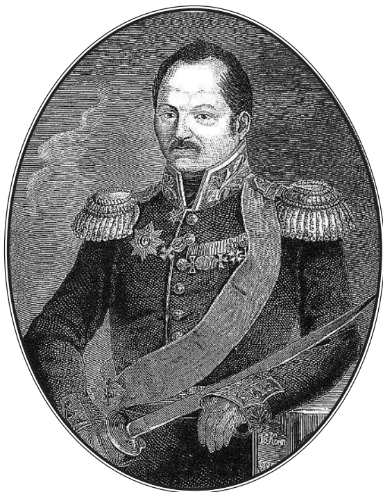
Сергей Иванович Маевский (1779—1848)

сказала про Аракчеева: «Une extrême méchanceté est toujours accompagnée d'un grain folie» 5 . Она до известной степени права; сам Аракчеев был человек здоровый, но все же он происходил из семьи, в которой была «крупница безумия». Допускать скрытую эпилепсию у графа Аракчеева мы не имеем права, но нельзя отрицать, что в его характере было много весьма характерного для эпилептиков; как мы видим, в его семье была эпилепсия.