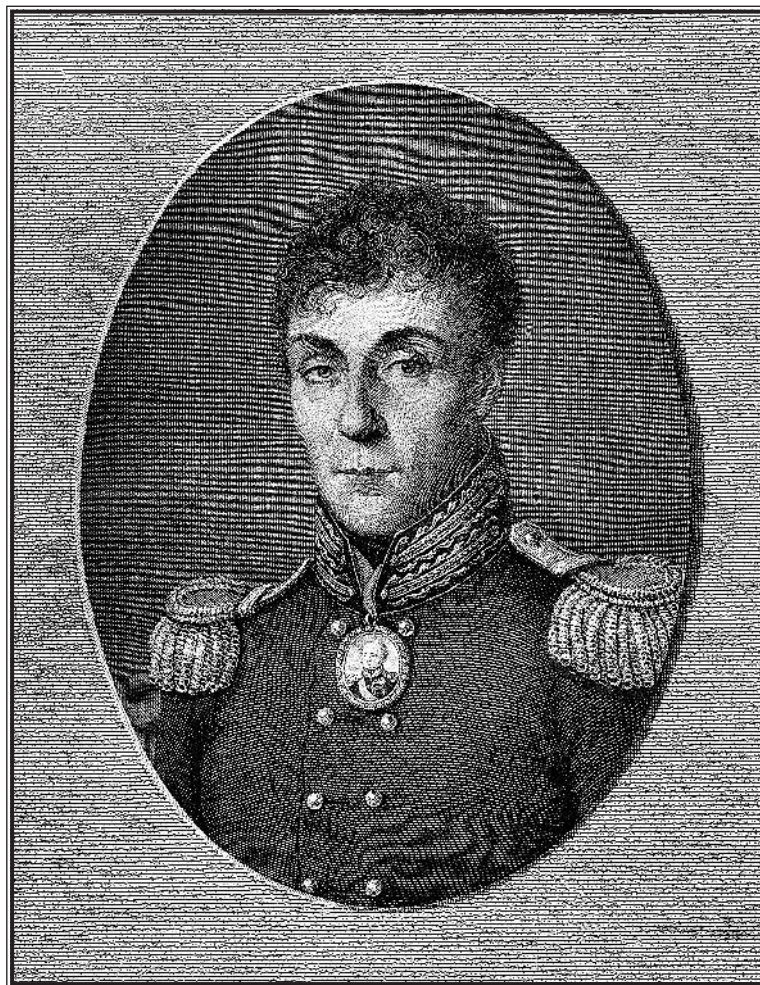
Н. И. Уткин. Портрет Алексея Андреевича Аракчеева. Гравюра 1818 г. с пастельного портрета И. Ф. Вагнера

организации Аракчеева. Само собою разумеется, что методологическое изображение исторического деятеля преследует другие цели, чем характеристика историка-художника.