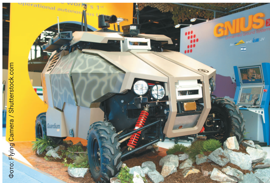
Техника типа UGV (Unmanned Ground Vehicle – «беспилотное наземное транспортное средство») Guardium на выставке Eurosatory-2008. Париж, Франция. 18 июня 2008 г.

Основное «оружие» Guardium – это следящие системы, видеокамеры, тепловизоры, собирающие информацию и мониторящие обстановку. Однако при необходимости на автомобиль могут устанавливаться 40-мм автоматический гранатомет, крупнокалиберный 12,7-мм пулемет, бронированный щит и устройство для метания гранат со слезоточивым газом.