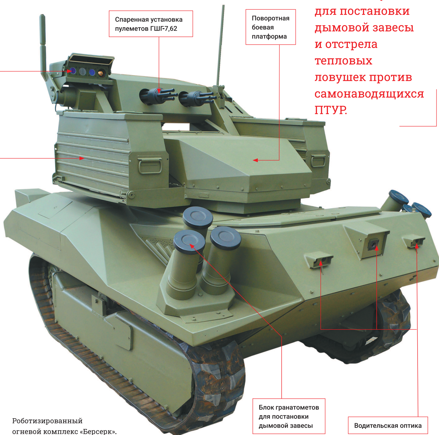
Роботизированный огневой комплекс «Берсерк».

Кроме пулеметов на комплекс установлена пара строчных гранатометов системы АЕК-902 «Туча» для постановки дымовой завесы и отстрела тепловых ловушек против самонаводящихся ПТУР.