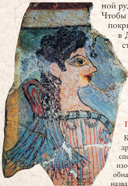
Парижанка. Ок. XV в. до н. э.

Чтобы росписи сохранялись дольше, их покрывали слоем смолы. Живопись в Древнем Египте служила преимущественно для украшения гробниц, храмов, дворцов и зданий, где жили знатные люди. Широкое распространение имели также живописные изображения на папирусе, например, многочисленные копии священной «Книги мертвых».