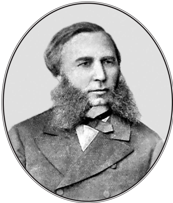
И. Д. Путилин. Фотография XIX в.

и способностям, это удалось. Иван быстро осознал, что спокойная служба в хозяйственном департаменте — это не для него, и в ноябре 1854 г. подал рапорт петербургскому обер-полицмейстеру с просьбой перевести его в штат полиции. Именно тогда появилась первая характеристика И. Д. Путилина, сделанная неизвестным чиновником: «Коллежский регистратор Иван Путилин известен как молодой человек благонравный,