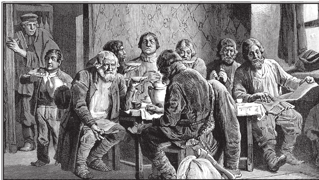
В. М. Васнецов. Чаепитие в таверне.