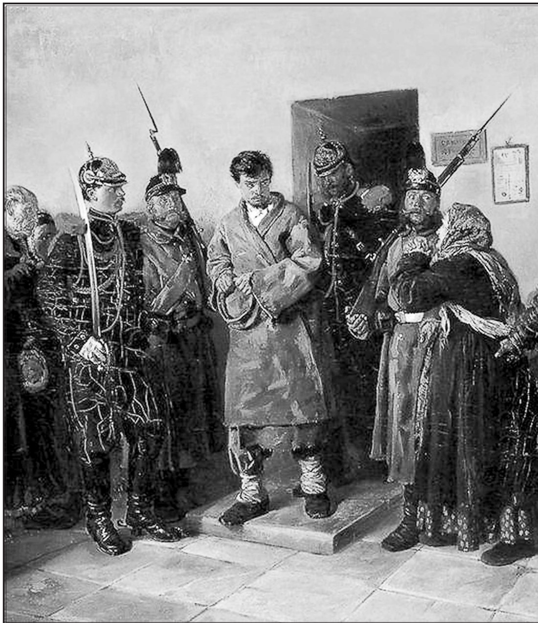
В. Е. Маковский. Осужденный. 1879 г.