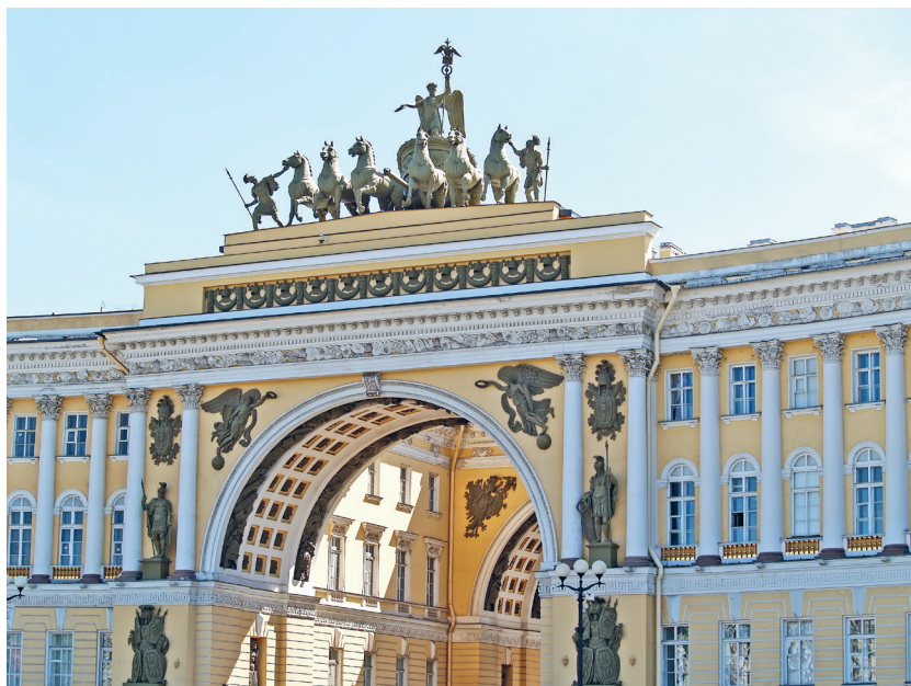
Арка Главного штаба