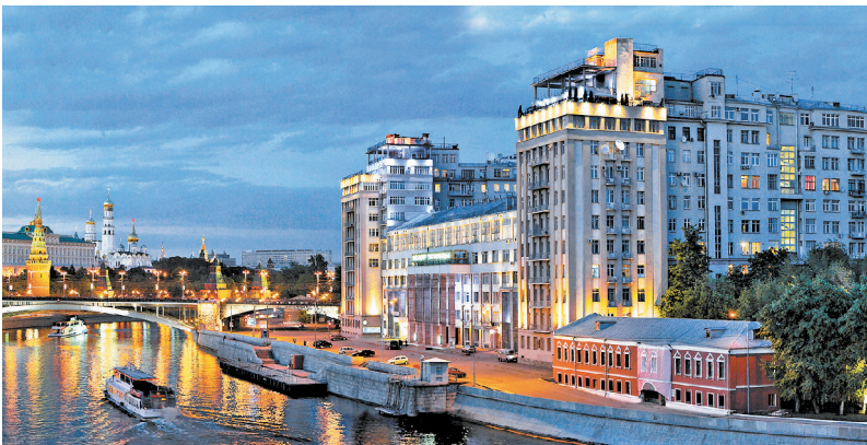
Серафимовича ул., 2

Через реку от символа царской власти стоит символ власти советской — Дом на набережной (Серафимовича ул., 2). Это первый серьезный советский проект в Москве. В 1931 году архитектор Борис Иофан закончил огромный жилой комплекс для «ответственных работников» ЦИК и СНК. Здесь было 505 квартир и полная инфраструктура: клуб, кинотеатр, библиотека, амбулатория, детский сад и ясли, столовая, парикмахерская, магазин обычный и спецраспределитель, спортивный зал и механическая прачечная. Дом на удивление некрасив. С какой стороны ни посмотришь, он воспринимается неловким нагромождением скучных объемов. Хотя строительство вышло в четыре раза дороже первоначальной