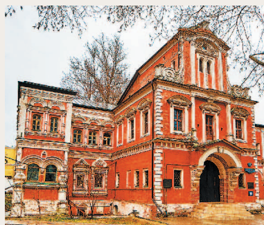
Берсеневская наб., 18–20–22

Палаты Аверкия Кириллова (Берсеневская наб., 18-20-22, стр. 3) и церковь сбоку от серой громады Дома на набережной рассказывают об истории этого уголка времен Москвы царской. Берег напротив Кремля был низкий, топкий и занятый в старину в основном садами да огородами. Вот и набережная называется Берсеневской — «берсень» по-старинному «крыжовник».