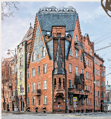
Соймоновский пр., 1

Мы с вами все еще на Патриаршем мосту и осмотрели не все здания вокруг. Напротив «Красного Октября» на углу стоит самый необычный московский дом (Соймоновский пр., 1). Он похож не на городское здание, а на декорацию к опере «Снегурочка». Дом сложен из нарочито «народных» деталей и покрыт керамическими панно со сказочными животными.