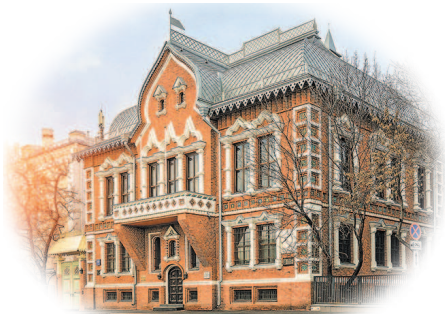
Пречистенская наб., 29