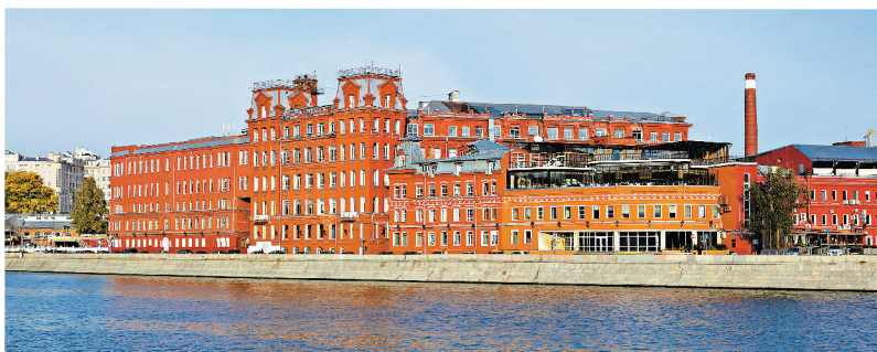
Берсеневская наб., 6–14