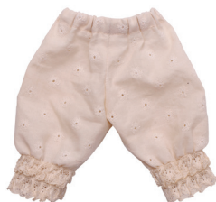
С Панталоны С. 6