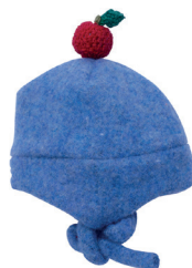
S Ушанка С. 40