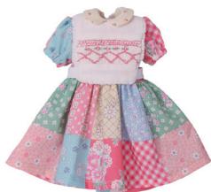
Г Платье с воротнич- ком, нагрудник С. 14