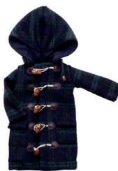
О Дафлкот С. 36