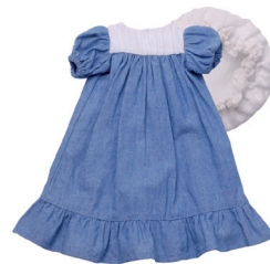
Ј Платье с защипами и кокеткой, шапочка для волос С. 22