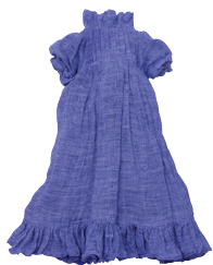
К Платье с защипами и оборками С. 24