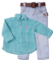
М Рубашка, джинсы С. 30