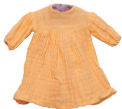
Е Платье Гренни С. 10