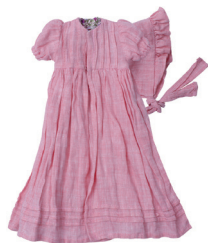
Л Платье с защипами, чепчик С. 28