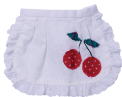
В Передник С. 4