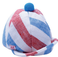
R Бейсболка С. 39