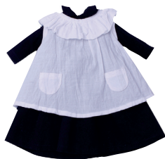
Н Платье с передником С. 16