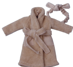
Ф Баннный халат, повязка для волос С. 12