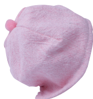
Q Чепчик С. 38