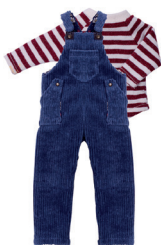
Н Футболка, комбинезон С. 32