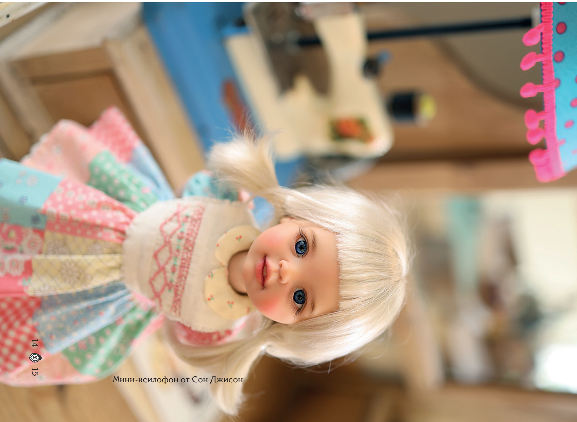
Мини-ксилофон от Сон Джисон