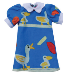
Д Платье с рукавами- фонариками С. 8