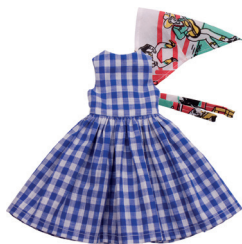
А Базовое платье, косынка С. 4