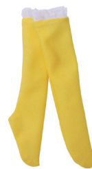
Р Чулки С. 8