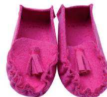
T Мокасины С. 41