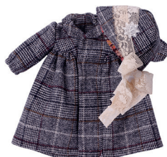
І Платье/пальто, шляпка клош С. 18