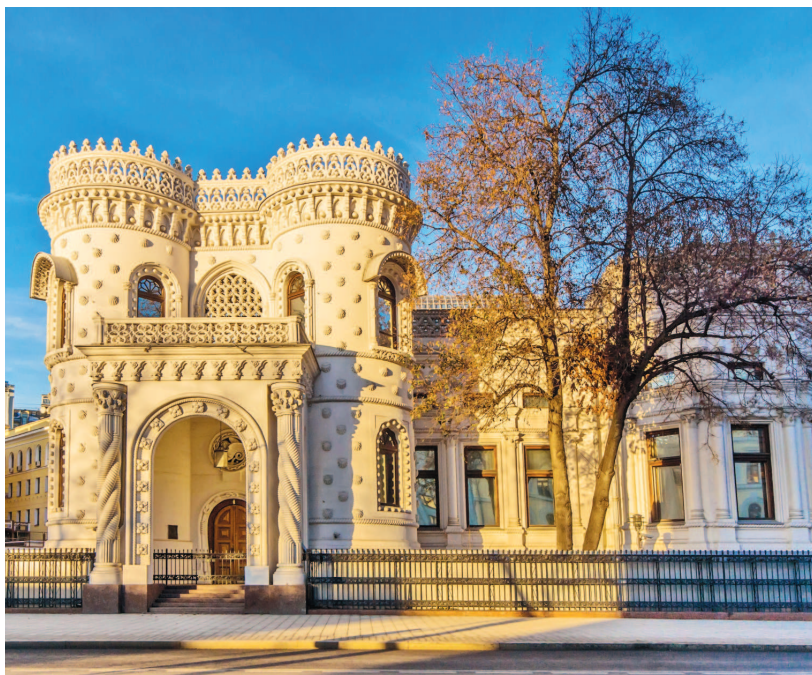
Особняк Арсения Морозова напротив «Арбатской»

где проводятся встречи с авторами, презентации новинок и литературные вечера.