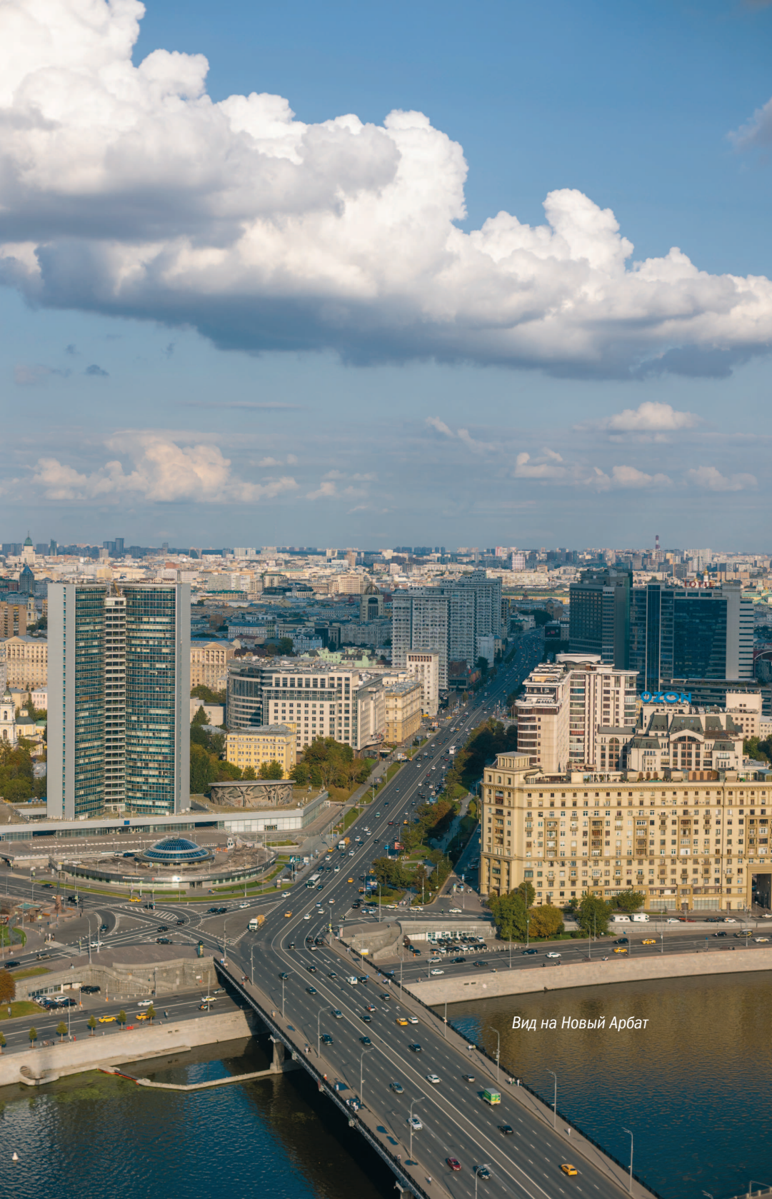
Вид на Новый Арбат