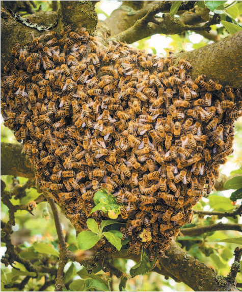
Хороший рой может весить от пяти до семи килограммов.