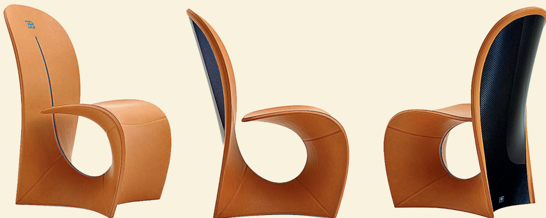
Карло Бугатти. Стул «Кобра». 1902. Музей искусств Карнеги, Питтсбург

Его примеру последует, спустя три десятилетия, лидер бельгийского модерна Анри ван де Велде (1863–1957), построивший для себя близ Брюссе-