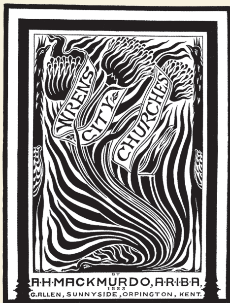
Артур Макмердо. Титульная страница книги «Церкви Рена в Сити». 1883. Музей Виктории и Альберта, Лондон

Вслед за социалистом Моррисом в эпоху модерна все чаще будут раздаваться голоса о необходимости стирания границ между элитарным и массовым искусством. Не только высшие сословия и богатые люди должны иметь возможность окружать себя прекрасными предметами быта, красота должна быть доступна всем. Но ручное производство, столь превозносимое Моррисом, в итоге оказывалось слишком дорогостоящим, и широчайшему распространению модерна поспособствовало производство промышленное, прекрасным примером чему служат массово тиражировавшиеся работы Альфонса Мухи, созданные им в парижский период его творческой деятельности. Более того, в распространении новых визуальных образов сыграли большую роль и многочисленные Всемирные