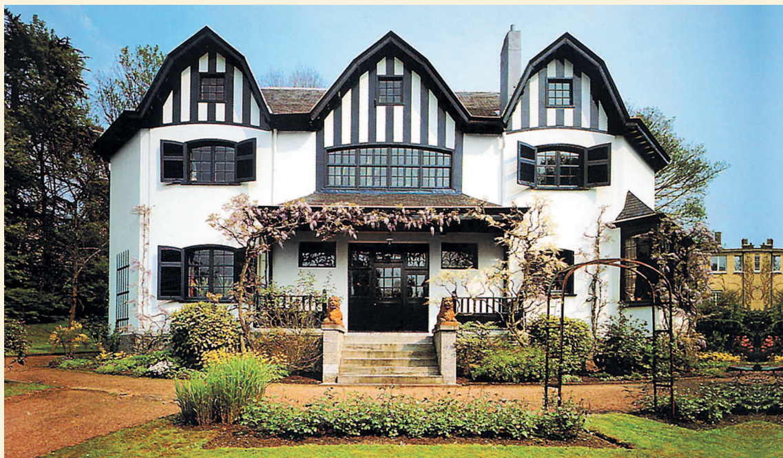
Анри ван де Велде. Дом «Блуменверф». 1895–1896. Уккель