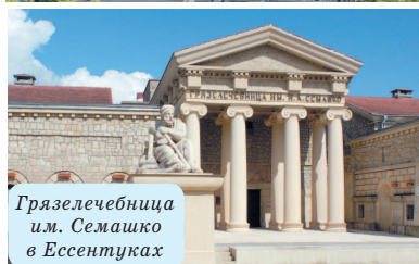
Грязелечебница им. Семашко в Эссентуках

Кавминводы предлагают возможность пожить в исторической части города и даже непосредственно в старинных зданиях. Например, Кисловодский санаторий «Крепость», расположенный на территории крепости, положившей начало городу.