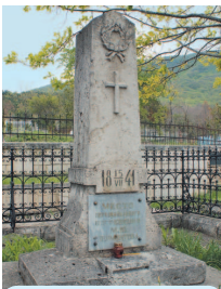
Место первоначального захоронения М.Ю. Лермонтова

Но не только лермонтовским духом пропитан Пятигорск. Живет здесь и дух героев Ильфа и Петрова. Многие другие известные литераторы посещали Пятигорск, оставивший след в их жизни и творчестве. Среди них: А.С. Пушкин, Л.Н. Толстой, А.Н. Толстой, С.А. Есенин, В.В. Маяковский, М.А. Булгаков, В.С. Высоцкий. Здесь жил и начинал литературную деятельность автор российского гимна С.В. Михалков.