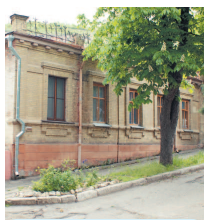
Дом княжны Мери