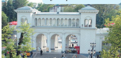
Колоннада на Курортном бульваре в Кисловодске

Во всех городах-курортах КМВ множество гостиниц, санаториев, пансионатов. Каждый может выбрать жилье с учетом потребностей и возможностей. Развита аренда квартир и частного сектора.