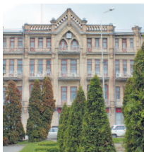
Здание, где ранее располагалась гостиница «Эрмитаж»