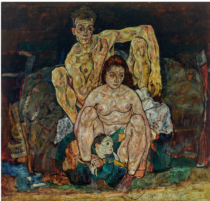
Эгон Шиле. Семья, 1918, Галерея Бельведер, Вена.

В 1918 году австрийский художник Эгон Шиле работал над картиной — портретом своей семьи. Он успел завершить лишь часть полотна, на котором, помимо него, были еще три фигуры: сам Шиле сзади, его изможденное обнаженное тело сгорблено, его меланхоличный взгляд отрешен, он смотрит сквозь зрителя.