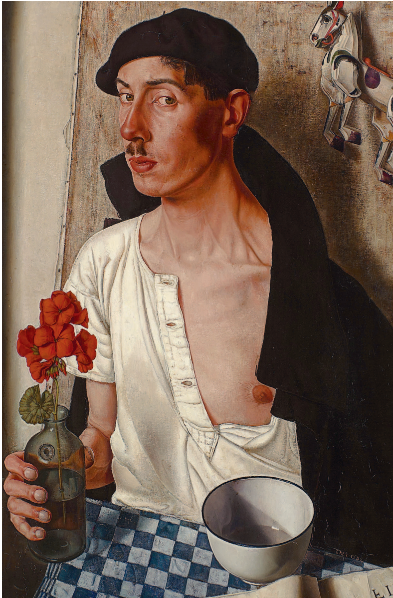
Дик Кет, «Автопортрет» (1932), Музей Бойманса-ван Бёнингена