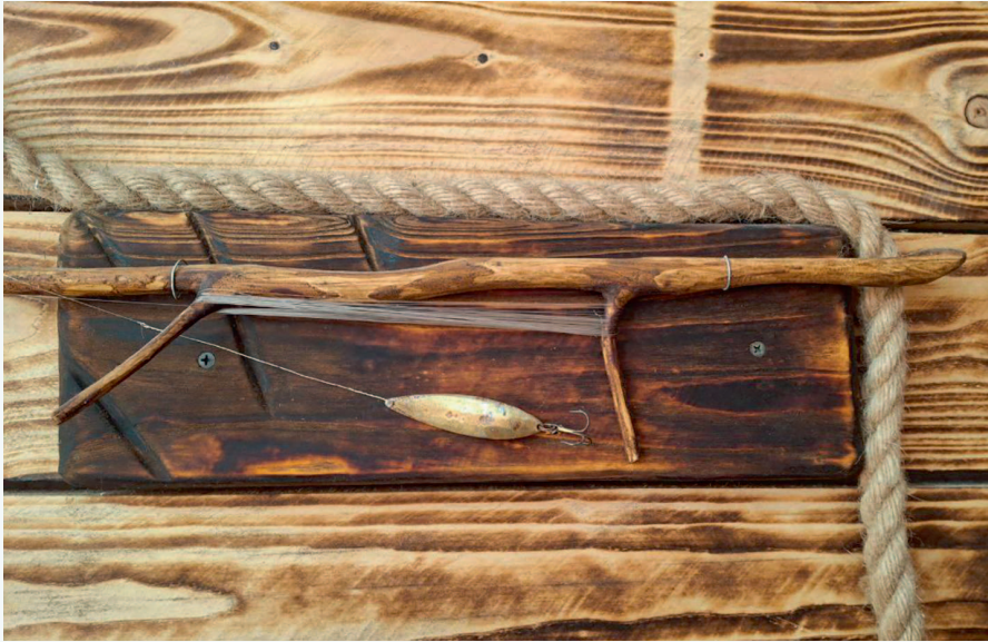
Мотовило из ветки с леской и самодельная блесна-колебалка из коллекции БООР

А вот еще пример. На фото – простейшая снасть для блеснения. Она хранится в коллекции Белорусского общества охотников и рыболовов (БООР). В рыболовной литературе описывают множество подобных приспособлений. В первой половине XX века они были широко распространены в разных регионах России. О тех временах мы еще поговорим в следующих главах.