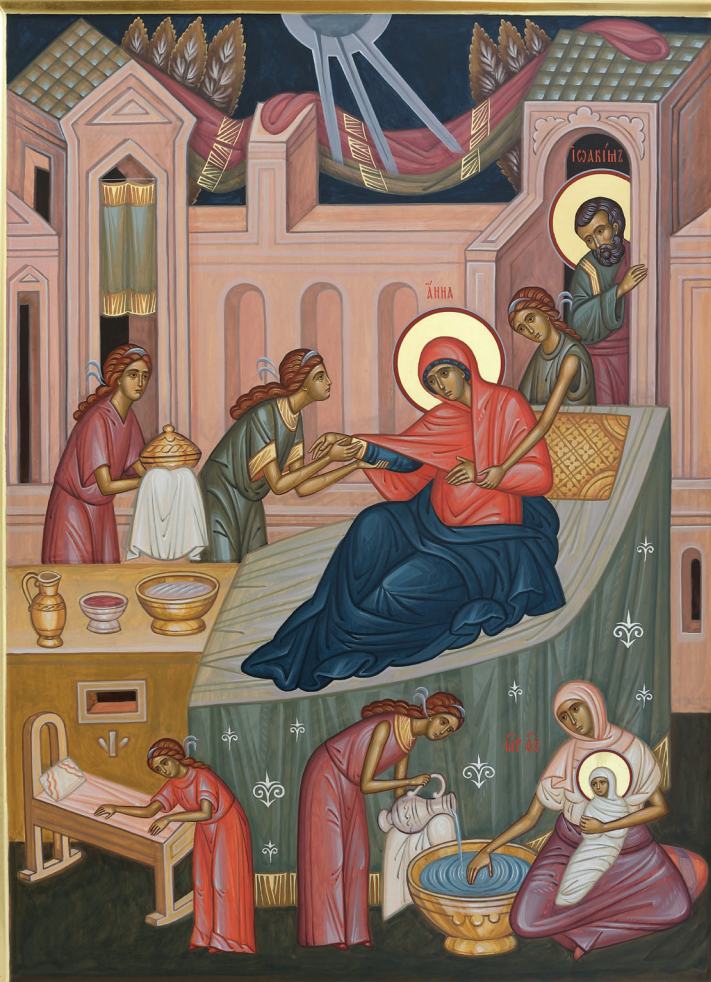
Рождество Пресвятой Богородицы