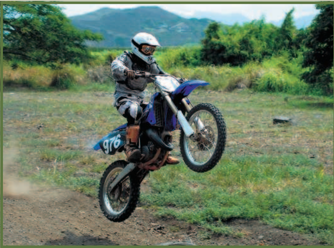
Спортивный (кроссовый) мотоцикл.