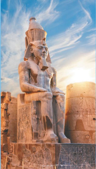
■ Статуя Рамсеса II. Луксорский храм. XIII в. до н. э.