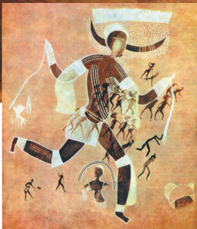
■ Белая богиня. Около 4 тыс. до н. э. Тассилин-Аджер, Сахара.