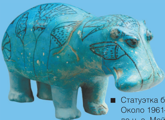
■ Статуэтка бегемота. Около 1961–1878 гг. до н. э. Мейр, Египет.