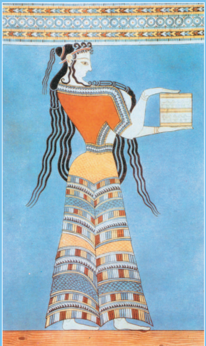
■ Микенская фреска. II тыс. до н. э.