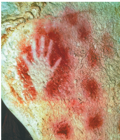
■ Отпечаток человеческой руки. Около 23 тыс. до н. э. Пещера Пеш-Мерль. Франция.