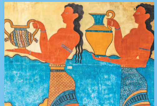
■ Виночерпии. Фрагмент росписей из дворца в Кноссе. II тыс. до н. э. Крит.