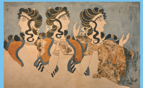
■ Дамы в голубом. Фрагмент росписи из дворца в Кноссе. II тыс. до н. э. Крит.