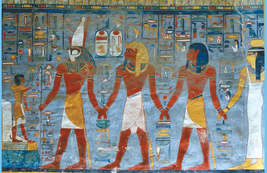
■ Древнеегипетские росписи в Долине Царей в Луксоре. Египет.