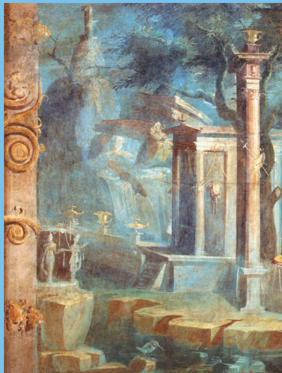
■ Пейзажная фреска из храма Исиды. Помпеи. Древний Рим. I в.