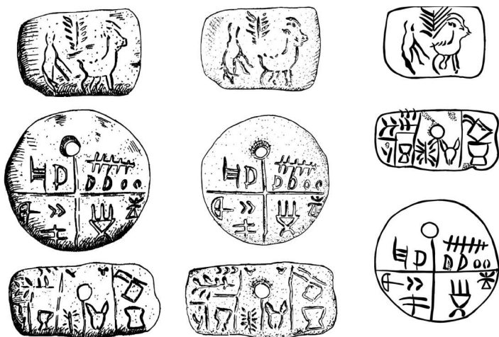
Тэртэрийские таблички, найденные в 1961 году в Румынии

Письменность история религии также считает одним из проявлений духовного поиска человечества, указывая, что именно необходимость записи священных текстов стала мотиватором возникновения пиктографики и иероглифики, эволюционировавших позднее в слоговое и алфавитное письмо 8 . К слову сказать, согласно мнению большинства представителей научного религиоведческого сообщества, найденные в 1961 году в Румынии так называемые Тэртэрийские таблички однозначно содержат в себе фиксацию культовых и обрядовых действий 9 .