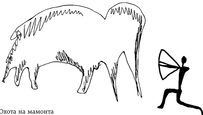
Охота на мамонта

Похожие гипотезы встречаются и относительно отраслей сельского хозяйства, а также охоты.