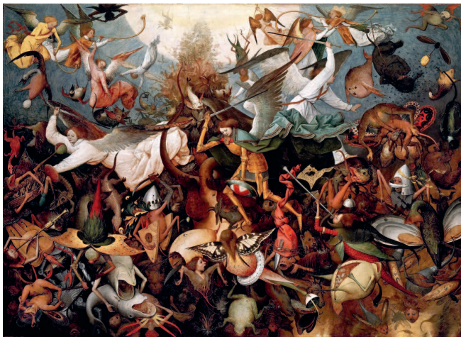
Питер Брейгель Старший. «Падение мятежных ангелов», 1562 г. Королевские музеи изящных искусств, Брюссель

Каждое столетие на свой лад и манер осовременивает Иеронима Босха. Его прискорбный апокалиптизм и повальный эсхатологизм отозвался и в зрителе XX–XXI веков. Заново увиденный сюрреалистами в XX веке — Босх стал зеркалом ужасов Первой и Второй мировых войн. Сальвадор Дали ощутил и увидел в нём предвестника осмысления опыта и последствий