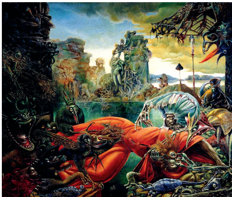
Макс Эрнст. «Искушение святого Антония», 1945 г. Музей Вильгельма Лембрука, Дуйсбург.

Не популярностью ли Босха при испанском дворе навеяны странные и страшные образы Франсиско Гойи? Обращение к Средневековью у художников-