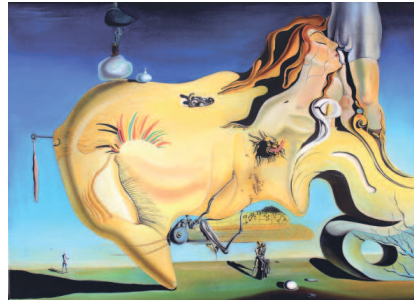
Сальвадор Дали. «Великий Мастурбатор», 1929 г. Центр искусств королевы Софии, Мадрид.

коллективных травм, а также личного бессознательного, Эроса и Танатоса, о которых писал Зигмунд Фрейд. Благодаря психоаналитическим прочтениям произведений искусства, через работы не только Фрейда, но и Карла Густава Юнга, Иероним вновь приобрел актуальность. Классические искусствоведы XX столетия не могли обойти вниманием столь значимую фигуру: появились достаточно глубокие исследования, анализирующие Босха в контексте искусства Средневекового и Возрождения, к ним относятся рассуждения Эрвина Пановски, книги Вильгельма Френгера. Однако реконструкция смыслов картин Иеронима нуждалась в тщательном и долгом исследовании, в кропотливом и методичном труде, что стало делом будущих поколений исследователей, которыми стали Шарль де Тольнай и Людвиг фон Балдас, они приоткрыли завесу непонимания работ художника. Нидерландский учёный Дирк Бакс, изучавший визуальный язык Босха в середине