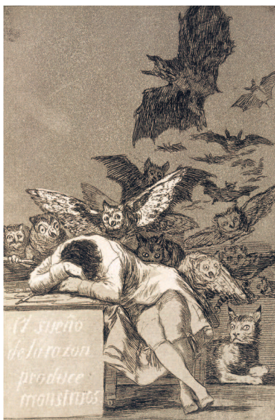
Франсиско Гойя. «Сон разума рождает чудовищ». 1797–1799 гг. Национальная библиотека Испании, Мадрид.