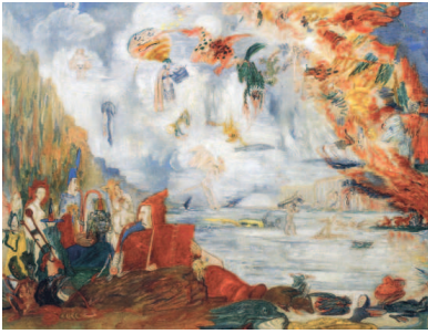
Джеймс Энсор. «Искушения святого Антония», 1909 г.