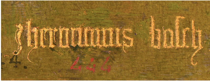
Автограф Иеронима Босха

то ли уже в Неймегене, где в дальнейшем и жил, получая художественные навыки вместе со своими двумя братьями. Позже Ян со своей женой перебрались в Хертогенбос, супруги стали членами религиозного сообщества Братства Богоматери. Ян приступил к исполнению художественных заказов в кафедральном Соборе святого Иоанна и со временем снискал определенный успех (вероятно, благодаря отсутствию сильной конкуренции). Четверо из пяти сыновей Яна, включая отца Иеронима — Антония ван Акена, — продолжили семейное ремесло. Антоний ван Акен женился на Алейд ван дер Муннен 12 февраля 1462 года и тогда же приобрёл дом на рыночной площади в Хертогенбосе (сегодня это дом №29), закрепив свой социальный статус. Там же расположилась мастерская семьи ван Акен. Антоний (судя по всему, он был художником средней руки, ординарным) получал свои заказы от Братства Богоматери, при котором состоял