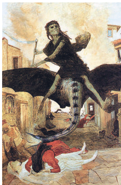
Арнольд Бёклин. «Чума», 1898 г. Базельский художественный музей, Базель.