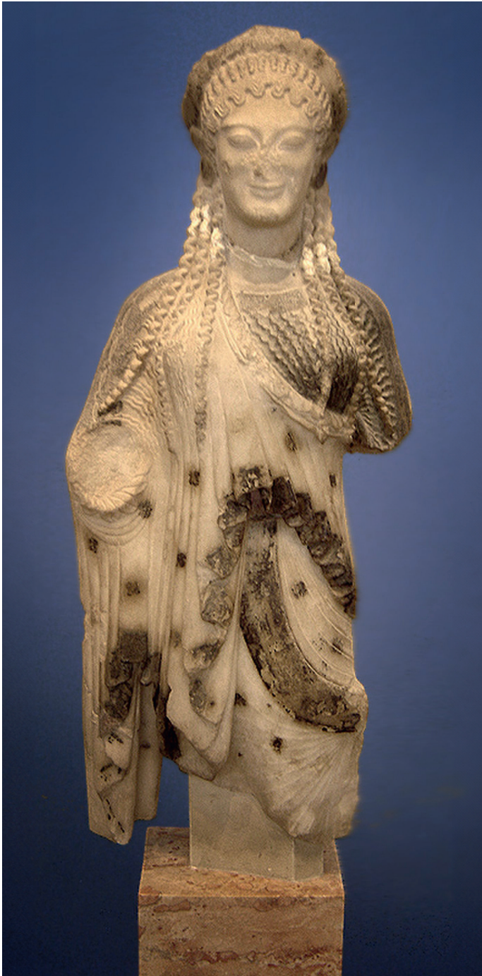
СКУЛЬПТОР АРХЕМОС «ХИОССКАЯ КОРА» 520-510 ГГ. ДО Н.Э. МУЗЕЙ АФИНСКОГО АКРОПОЛЯ

Вторым типом скульптуры архаики стала кора. В ее теле сохраняется та же напряженность, что и у курса, но дева выглядит более естественно благодаря различным деталям: украшениям на голове, задрاپированной одежде, доходящей до пола. Кроме того, ее руки неплотно прилегают к телу. Известно, что одной рукой коры зачастую придерживали одежды или же просто что-то в ней держали.