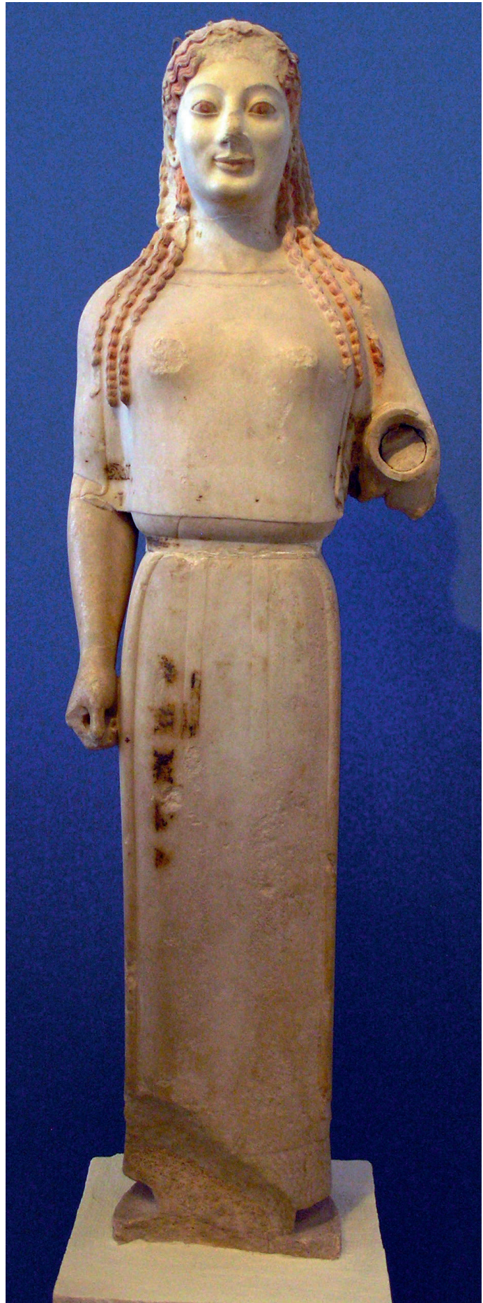
«КОРА В ПЕПЛОСЕ» ОК. 530 Г. ДО Н.Э. НОВЫЙ МУЗЕЙ АКРОПОЛЯ, АФИНЫ

Вторым типом скульптуры архаики стала кора. В ее теле сохраняется та же напряженность, что и у курса, но дева выглядит более естественно благодаря различным деталям: украшениям на голове, задрاپированной одежде, доходящей до пола. Кроме того, ее руки неплотно прилегают к телу. Известно, что одной рукой коры зачастую придерживали одежды или же просто что-то в ней держали.