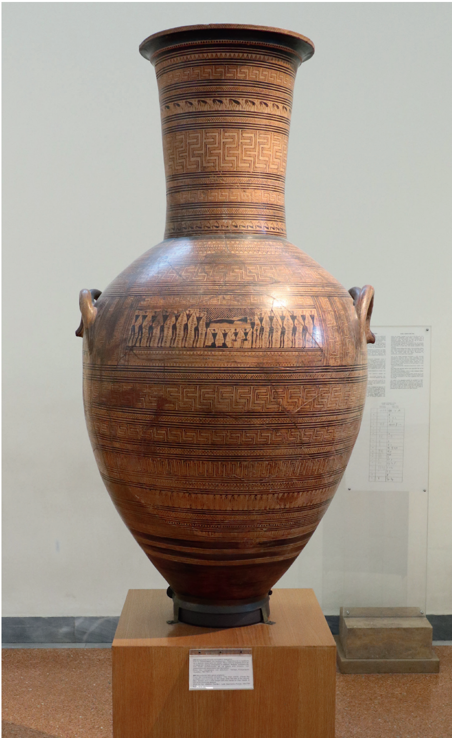
ДИПИЛОНСКАЯ ВАЗА 760-750 ГГ. ДО Н.Э. НАЦИОНАЛЬНЫЙ АРХЕОЛОГИЧЕСКИЙ МУЗЕЙ, АФИНЫ

Чем больше люди делали подобных сосуды, тем сложнее становился рисунок. Наивысшей точкой гончарного дела того времени стали дипилонские амфоры — огромные, с человеческий рост, сосуды, на которые наносилась целая система знаков. Название они получили по месту, где были обнаружены.