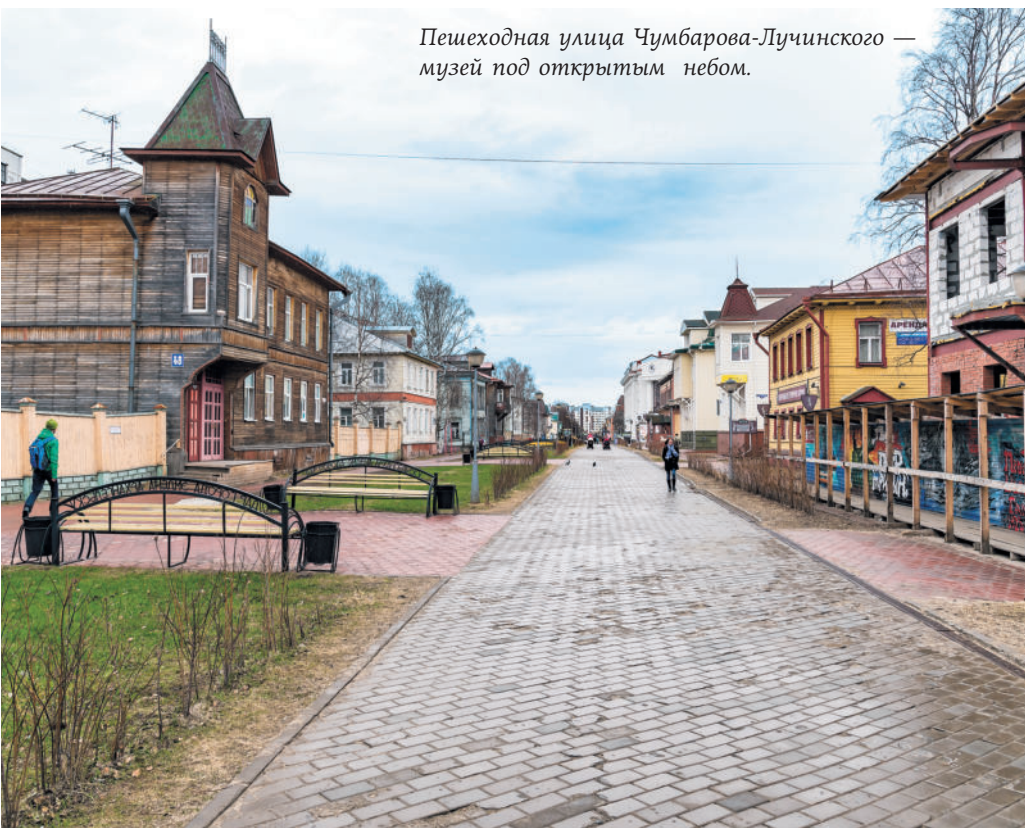
Пешеходная улица Чумбарова-Лучинского — музей под открытым небом.

Архангельск стал первым крупным морским портом России и до конца XVII в., вплоть до выхода России к Балтийскому морю, оставался главным портом Московского государства. При Петре I торговый город стал еще и центром морского судостроения. В конце XIX — начале XX в. Архангельск превратился в крупнейший лесопромышленный и лесозэкспортный центр. Город также стал важной базой для освоения Арктики.