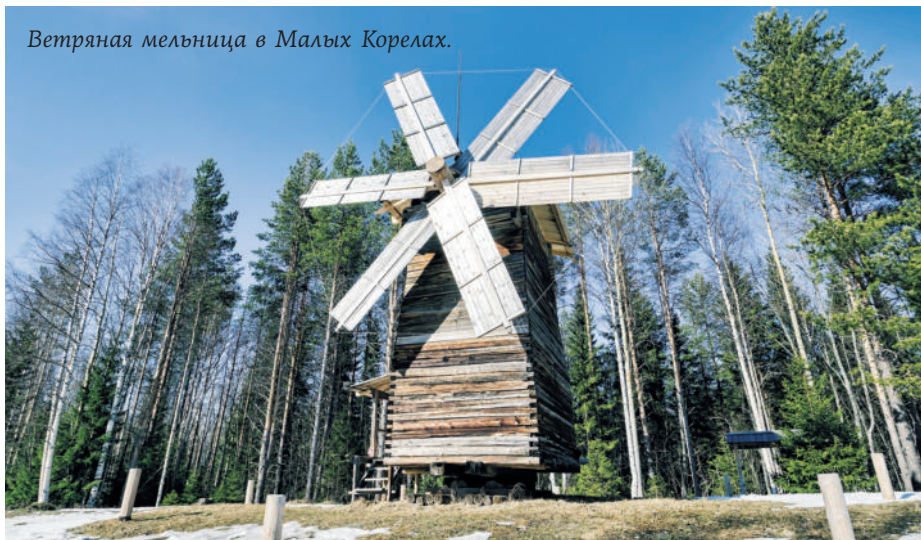
Ветряная мельница в Малых Корелах.