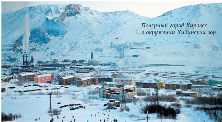
Полярный город Кировск в окружении Хибинских гор.

Лапландский заповедник известен как родина лапландского Деда Мороза. Весь год можно посетить его терем, украшенный рисунками, письмами и подарками детей, нашептать свое заветное желание в его волшебную варежку. Зимой Дед Мороз сам встретит вас в своих угожьях. Он любит играть, загадывать новогодние загадки, устраивать конкурсы, викторины и гадания.