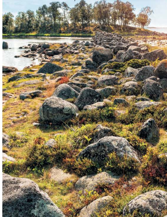
Филипповские садки — рукотворная плотина в Белом море.