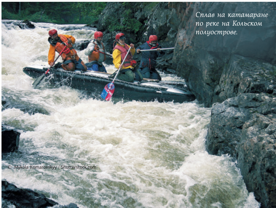
Сплав на катамаране по реке на Кольском полуострове.

Практически весь Кольский полуостров находится за полярным кругом, потому смена дня и ночи здесь различается от сезона к сезону гораздо сильнее, чем в средней полосе России. Летом, в полярный день, солнце, склоняясь к горизонту, заходит за него совсем ненадолго. Вскоре оно вновь появляется недалеко от того места, где закатилось. А зимой, в полярные ночи, день едва обозначается хмурыми сумерками... Зато в эту пору, даже чуть ранее (с конца августа), здесь можно увидеть фантастические по красоте северные сияния — самое впечатляющее атмосферное явление Арктики.