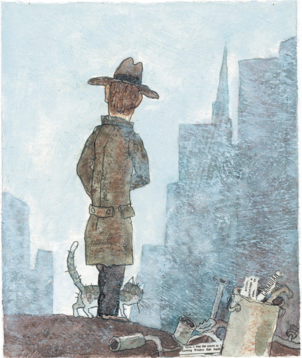
Рисунки Д. Трубина