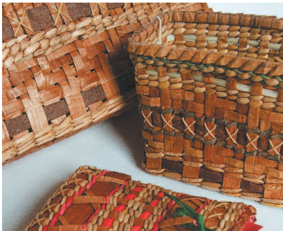
Корзины, сделанные из коры канадского кедра, автор Банти Болл.

В каждой культуре применяются собственные стили, приемы и материалы. Для этого используются местные растения, при помощи которых создается множество разнообраз-