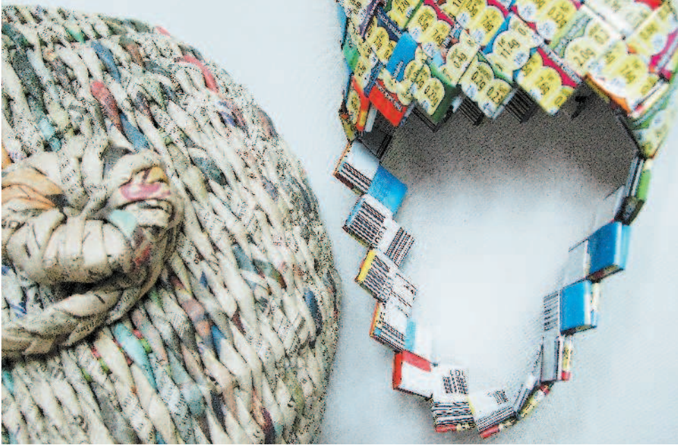
Корзина, сплетенная из свернутых полосок газет (неизвестный мастер), и корзина, сделанная из пакетиков (автор Эми Честнатт).

ных структур. Получающиеся изделия — это не только корзины, но и заборы, различный инвентарь, игрушки, обувь, одежда и даже дома.