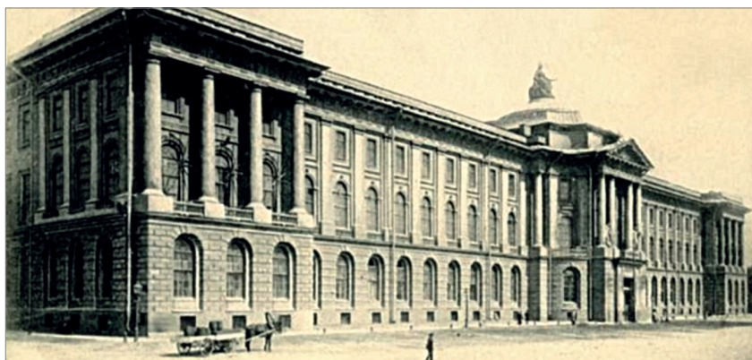
Императорская Академия художеств

Семья Рерихов жила на Васильевском острове, на Университетской набережной, в доме № 25. Недалеко от дома плескались волны Невы, высились здания Академии художеств, Санкт-Петербургского университета, Академии наук.