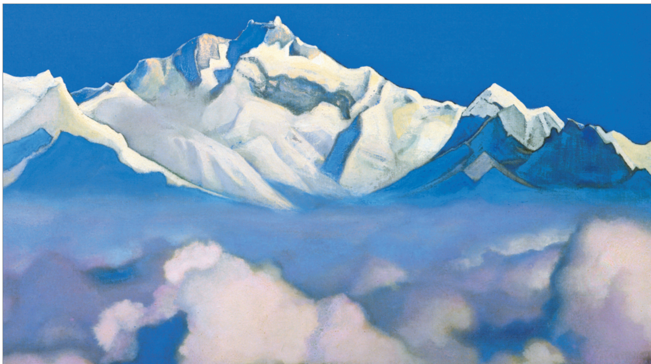
Н. К. Рерих. Канченджанга. 1936. Фрагмент

Ивановский производил исследования местных курганов, и это тем более подкрепило желание узнать эти старые места поближе. К раскопкам домашние относились укоризненно, но привлекательность от этого не уменьшалась. Первые находки были отданы в гимназию, и в течение всей второй половины гимназии каждое лето открывалось нечто весьма увлекательное» 5 .