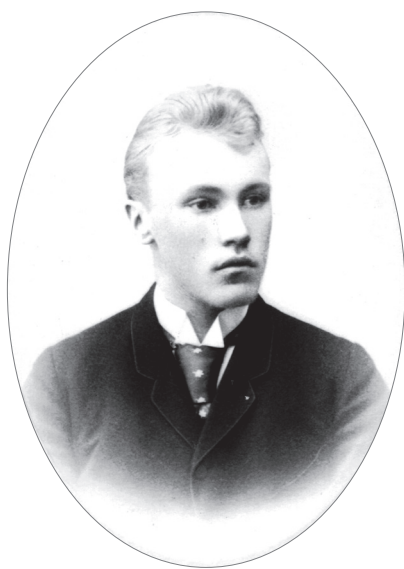
Николай Рерих. 1892

Наряду с талантом художника рано проявился и литературный дар Рериха. Юный Николай сначала записывал в тетради народные предания, легенды, сказания, затем стал писать и собственные рассказы. Уже в подростковом возрасте он прекрасно владел пером и писал статьи и очерки, публиковавшиеся в столичных журналах. Значительная их часть была посвящена его охотничьим приключениям и наблюдениям за природой, без общения с которой он не мыслил своего существования. Рериху было всего 15 лет, когда его первые охотничьи рассказы были опубликованы в журналах «Природа и охота» и «Русский охотник».