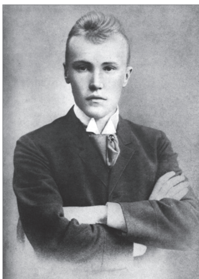
Николай Рерих. 1893

Уже первые работы Рериха во время его учебы в Академии были посвящены любимой им теме — истории Древней Руси. Он пришел в Академию с четко определившимися интересами и предпочтениями: его привлекала прежде всего историческая живопись. И уже с ранних пор Николай Рерих сознавал, что его подход к исторической живописи существенно отличается от подхода, воплощенного в работах его знаменитых предшественников — В. Сурикова,