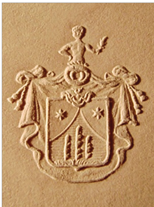
Герб семьи Рерихов