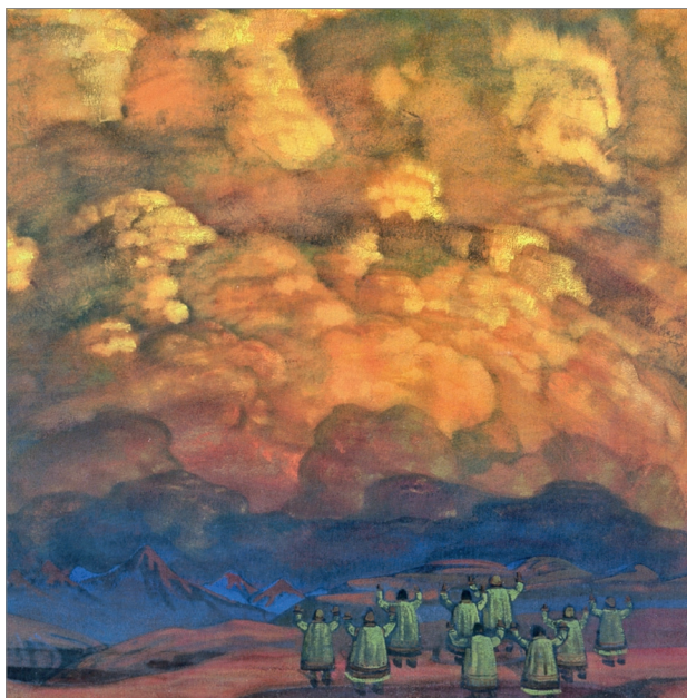
«Веления Неба». 1915. Фрагмент

Блуждая по лесу с ружьем в руках, Николай засматривался на причудливые очертания облаков, видя в них то неведомых животных, то прекрасные замки, то образы легендарных героев... «От самых ранних лет небесное зодчество давало одну из самых больших радостей, — признавался художник. — Среди первых детских воспоминаний прежде всего вырастают прекрасные узорные облака. Вечное движение, щедрые перестроения, мощное творчество надолго привязывало глаз ввысь. Чудные животные, богатыри, сражающиеся с драконами, белые кони с волнистыми гривами, ладьи с цветными золочеными парусами, заманчивые призрачные горы — чего только не было в этих бесконечно богатых неисчерпаемых картинах небесных! Без них и охота, и первые раскопки не были бы так привлекательны, и в раскопках, и в большинстве охот глаз все-таки устремлен вниз, и это не наскучит, лишь зная, что вверху уже готова заманчивая картина. Сколько раз из-за прекрасного облака благополучно улетал вальдшнеп или стая уток и гусей спасалась неприкосновенно! 10 »