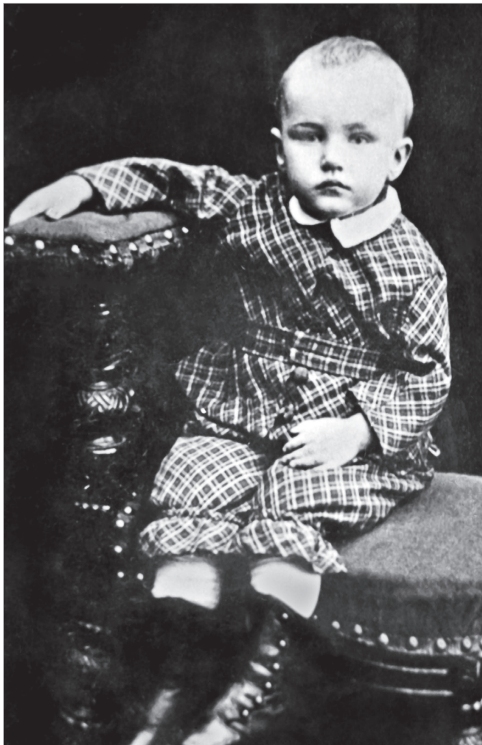
Самая ранняя детская фотография Николая Рериха. 1877

9 октября (по старому стилю — 27 сентября) 1874 года в Санкт-Петербурге, в доме на Васильевском острове, в семье известного нотариуса появился на свет мальчик, которому суждено было стать знаменитым на весь мир художником, исследователем, общественным деятелем.