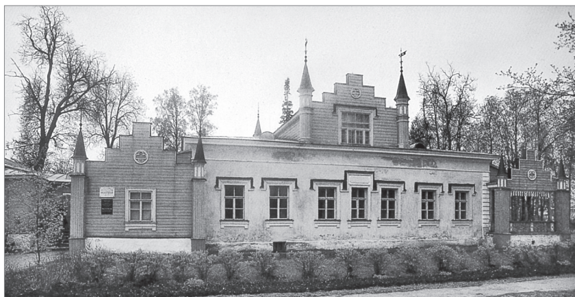
Извара, имение Рерихов под Санкт-Петербургом

Самые светлые воспоминания детства были связаны у Рериха-младшего с пребыванием в Изваре — имении отца под Петербургом, недалеко от станции Волосово, где семья Рерихов проводила летние месяцы.