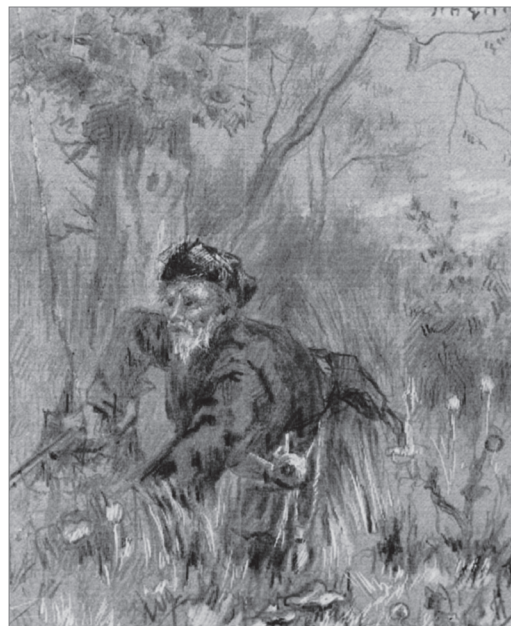
Рисунки Н. Рериха: «Иван лесник» и «Лисица». 1894

Конечно, основной целью охотничьих походов юного Рериха была не добыча медведей и рысей, а общение с природой. Как подчеркивал он сам, «убийственная часть этого занятия скоро отпала, просто сама собой отмерла, стала несовместимой. Но впечатления весенних ночей и восходов, гомон птичьего базара, длинные хождения по зимним лесам — все это навсегда вносит особый склад жизни. Недаром охотничьи команды являются самыми зоркими и подвижными воинскими частями — они больше всего соприкасаются с природою» 9 .