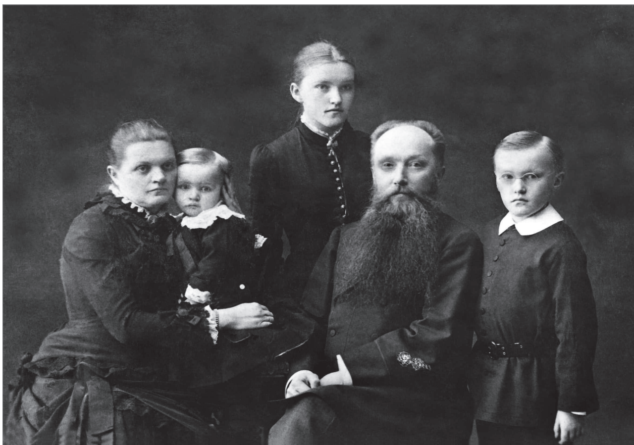
Семья К. Ф. Рериха. Слева направо: Мария Васильевна с сыном Владимиром 1 , Лидия, Константин Федорович, Николай.