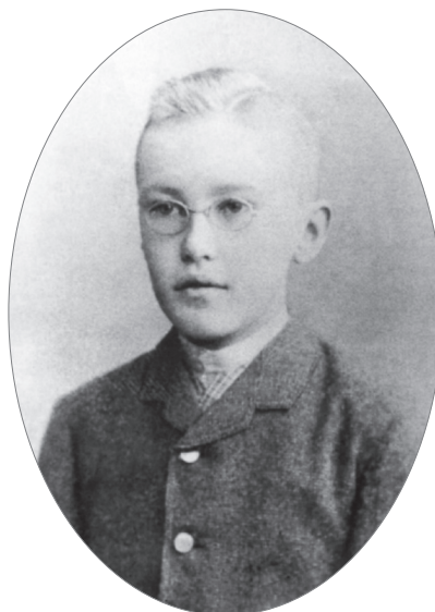
Николай Рерих — гимназист. 1884

Николая Рериха неодолимо влекли к себе тайны прошлого. С детства он интересовался историей. А вскоре любовь к истории дополнилась у Николая увлечением ее неизменной спутницей — археологией. Ему было всего девять лет, когда в Извару приехал видный археолог Лев Константинович Ивановский (1845–1892), чтобы вести в ее окрестностях археологические раскопки. Любознательный воспитанник гимназии заинтересовался новым для него занятием, и ученый разрешил ему принимать участие в раскопках. «Около Извары почти при каждом селении были обширные курганные поля от X века до XIV, — вспоминал художник впоследствии. — От малых лет потянуло к этим необычным странным буграм, в которых постоянно находились занятные металлические древние вещи. В это же время