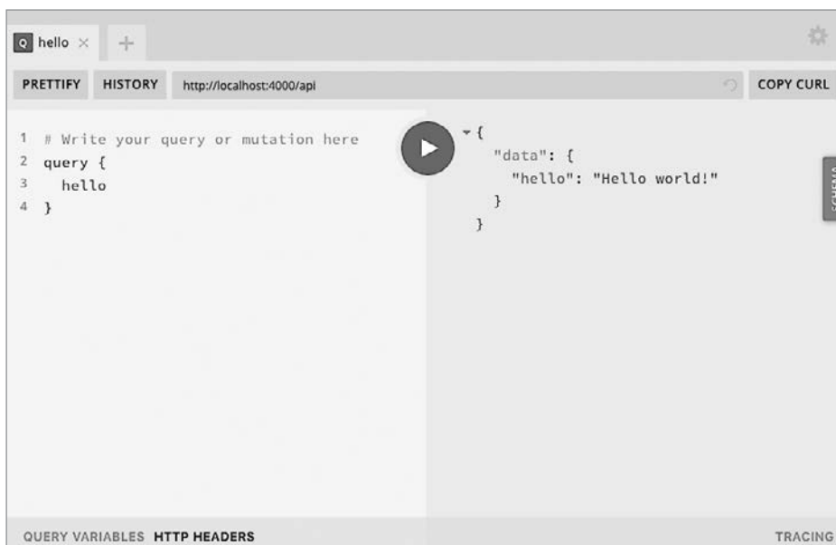
Рис. 4.2. Запрос hello