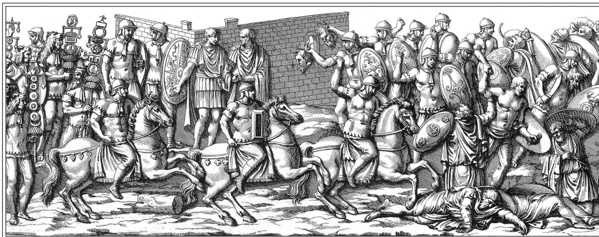
Римские солдаты показывают головы дакийских пленников императору Траяну.

Гравюра Пьетро Санти Бартоли по барельефам с колонны Траяна. 1672 г.