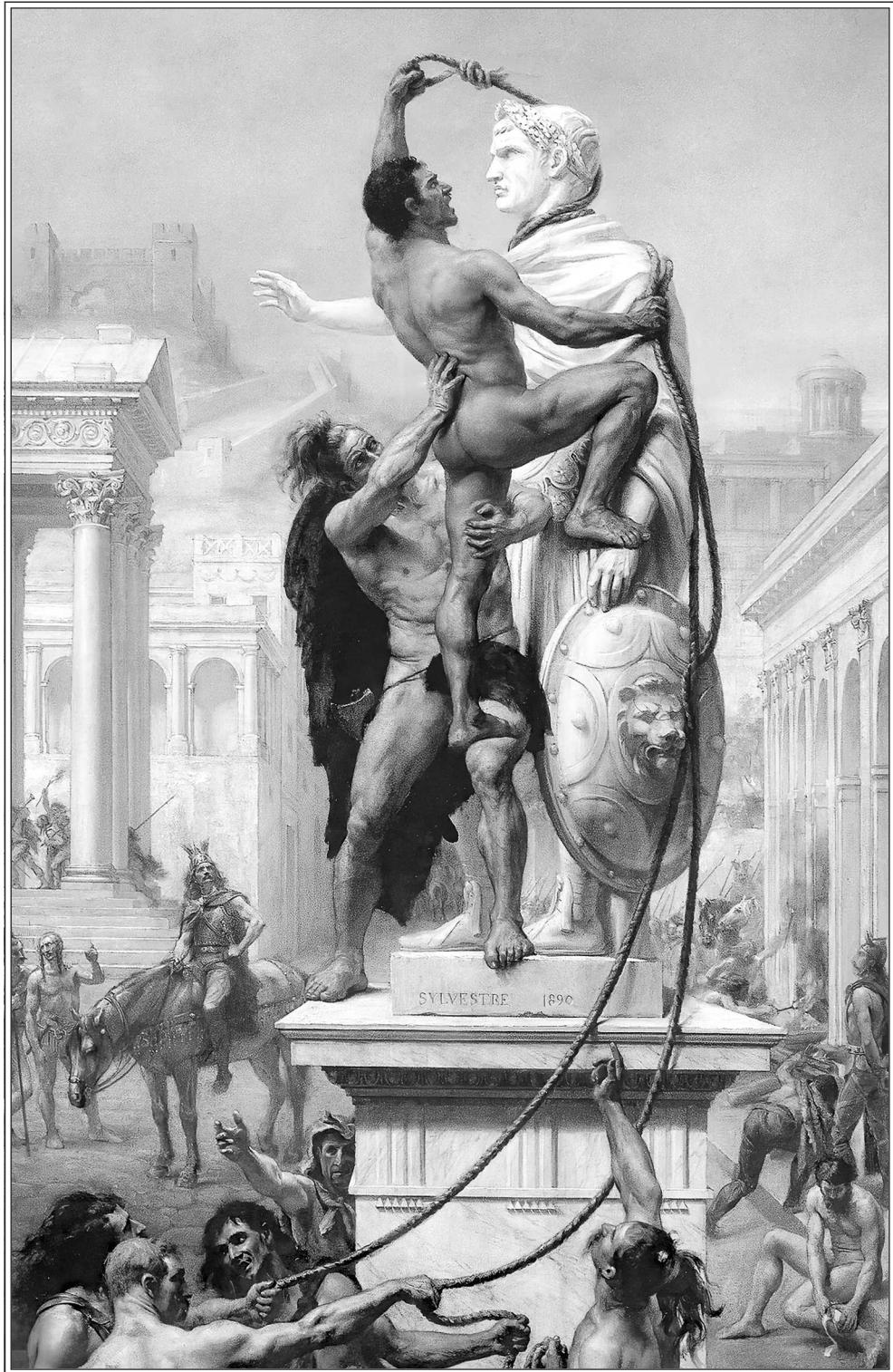
Разграбление Рима вандалами в 410 году. Картина Жозефа Ноэля Сильвестра. 1890 г.