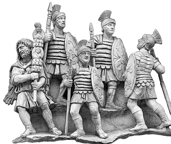
Римские легионеры времен Антонина Пия. Рельеф цоколя колонны Антонина Пия. 161 г.

Девятисотлетние войны мало-помалу внесли в военную службу много изменений и улучшений. Легионы, какими их описывал Полибий 1 и какими