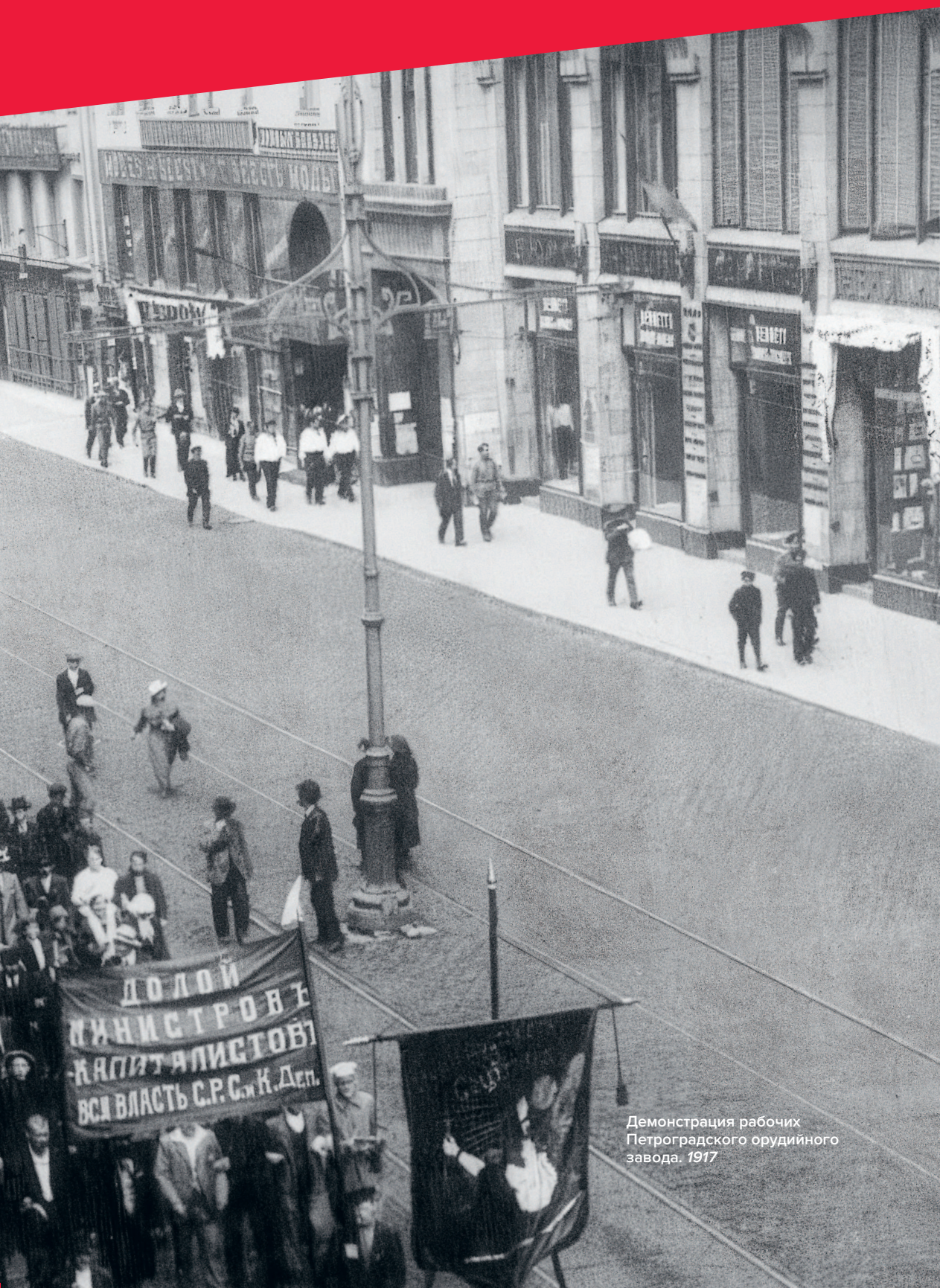
Демонстрация рабочих Петроградского оружейного завода. 1917