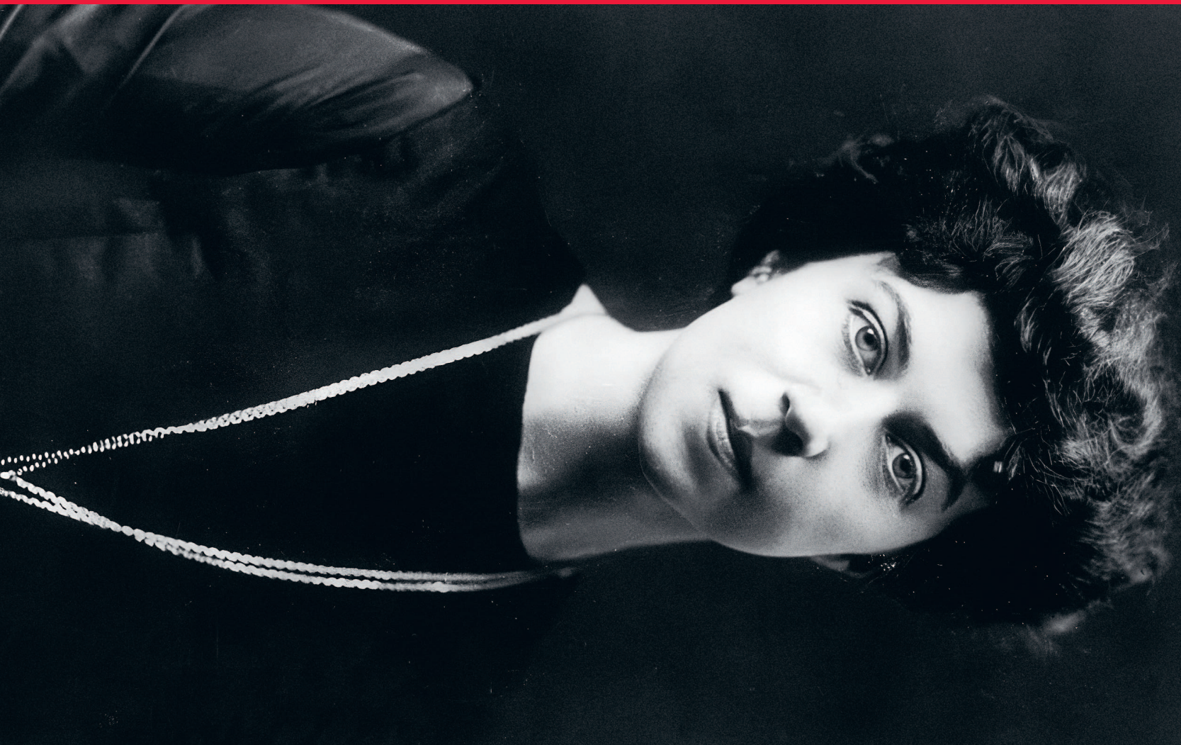
Александра Коллонтай. 1900