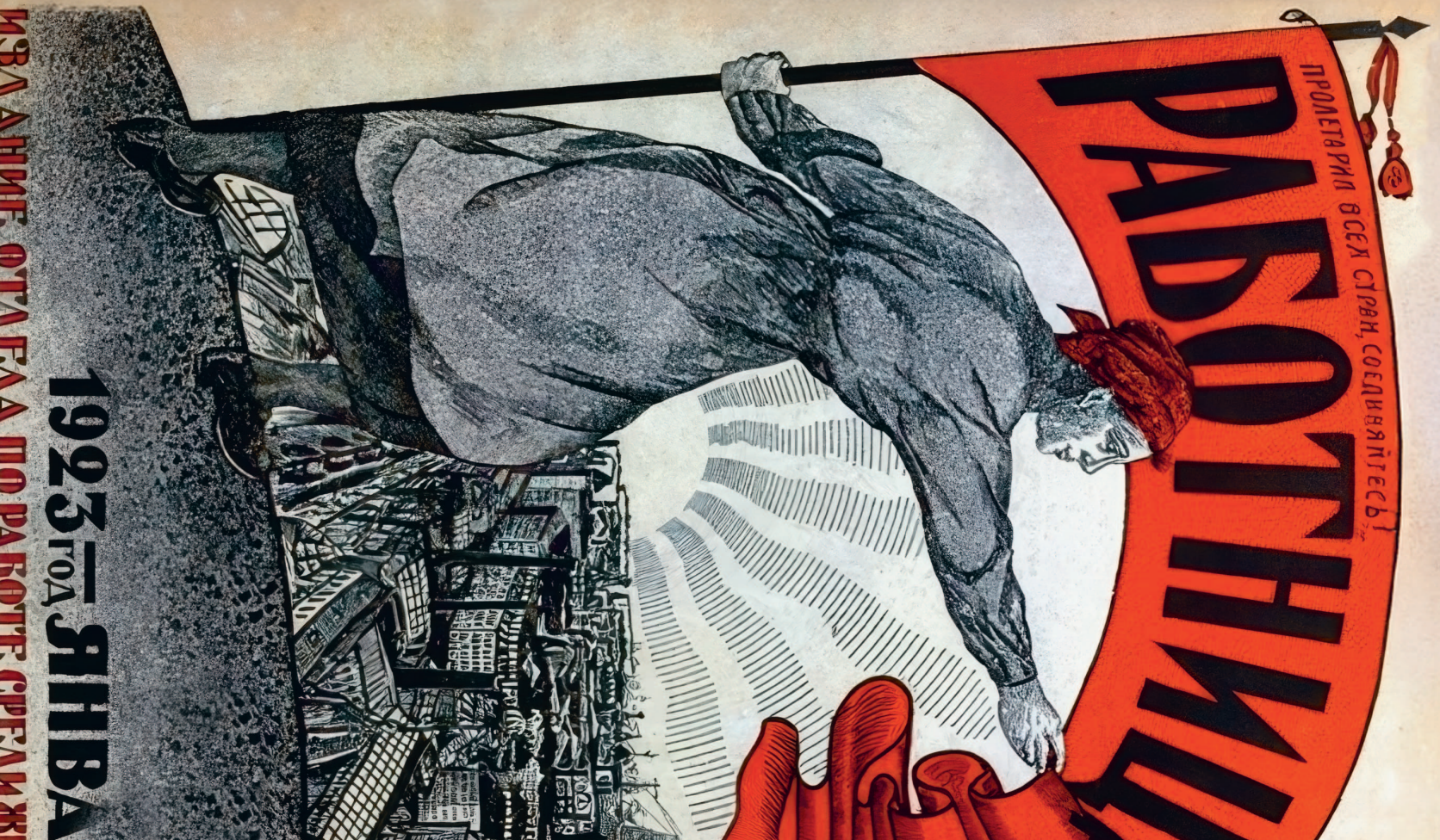
Обложка журнала «Работница». 1923