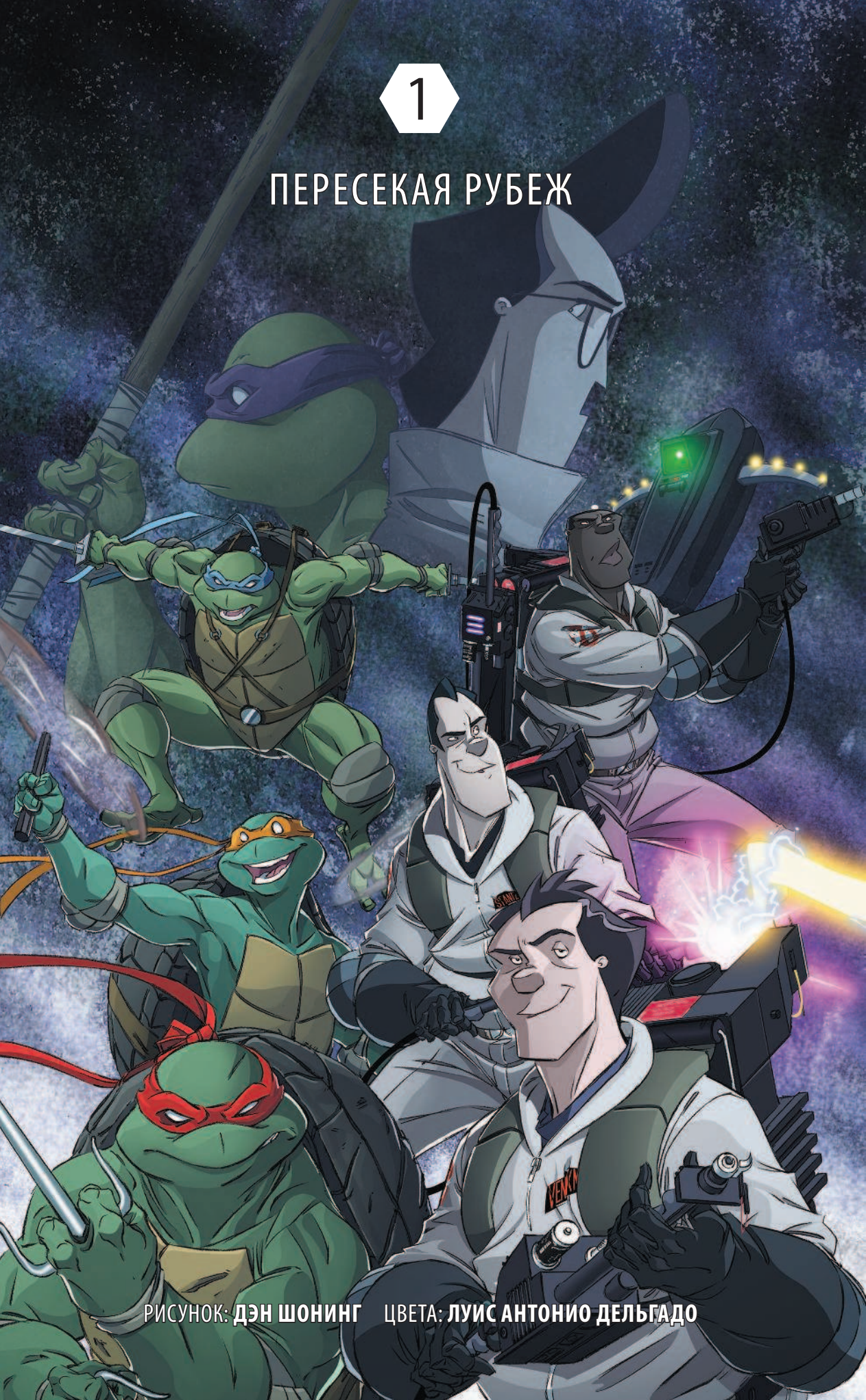
РИСУНОК: ДЭН ШОНИНГ ЦВЕТА: ЛУИС АНТониО ДЕЛЬГАДО