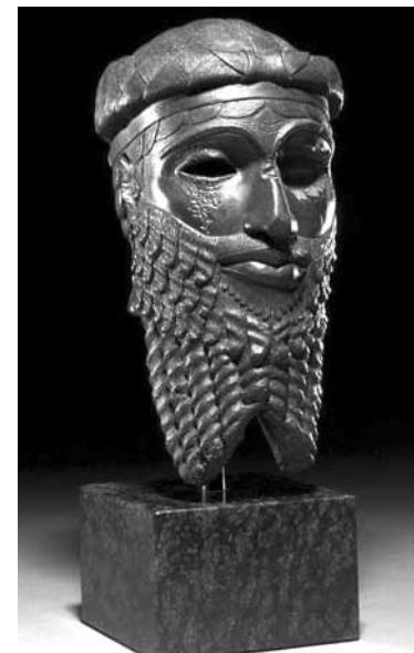
Маска ассирийского царя Саргона

женщины, которая в тот или иной момент пользовалась наибольшей благосклонностью Саргона. Не исключено, что в ней время от времени по тем или иным причинам жил и сам царь. В обоих концах комнаты находились платформы, которые образовывали широкие и глубокие альковы. Не совсем ясно, почему там были устроены два спальных места. Поскольку они, похоже, были совершенно идентичны, сомнительно, чтобы одно из них использовалось для какой-либо