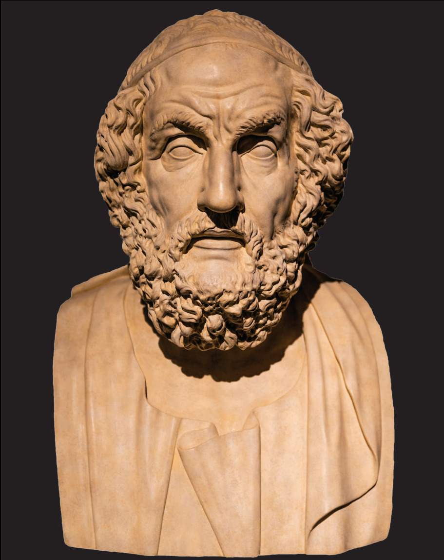
Гомер. Скульптура II в до н. э.