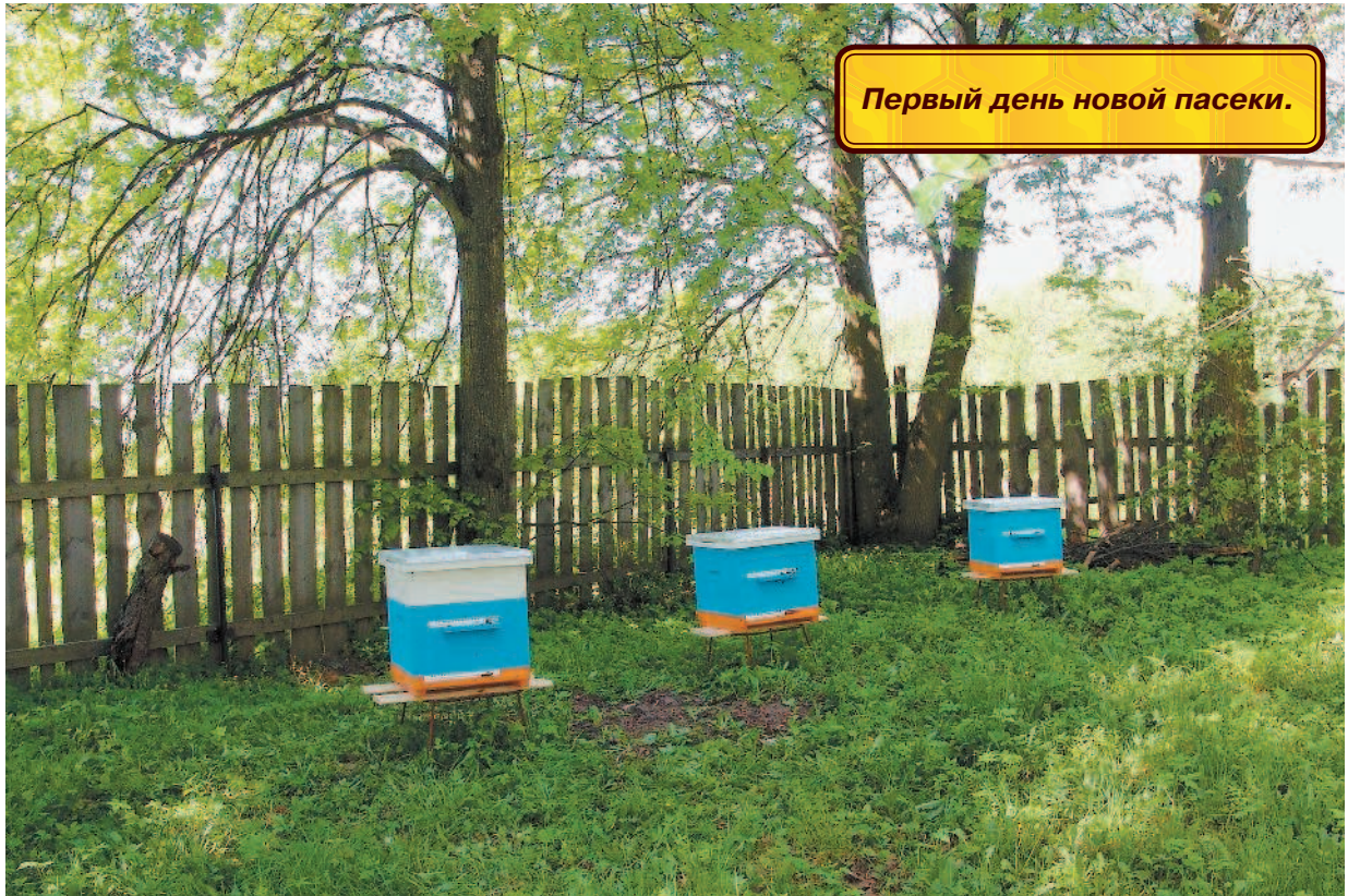
Первый день новой пасеки.