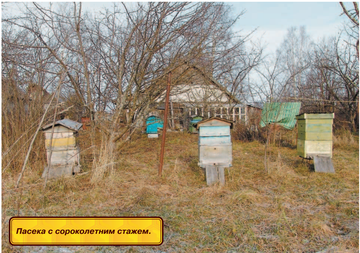
Пасека с сороколетним стажем.