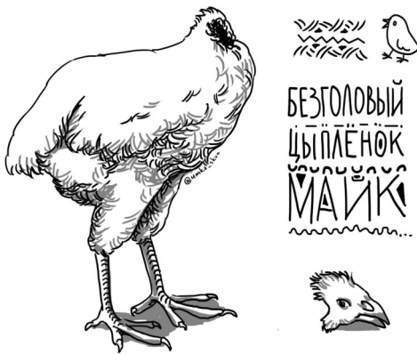
Он прожил без головы полтора года