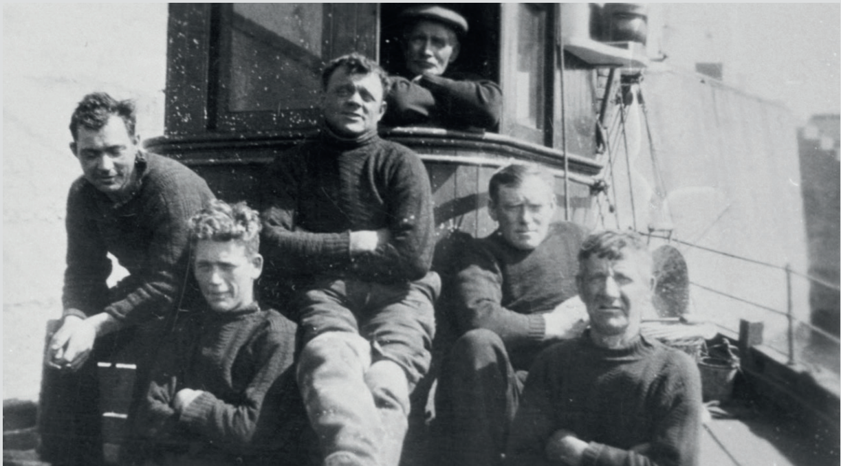
Команда рыбаков судна «Суд Всевышнего», порт Керколди.