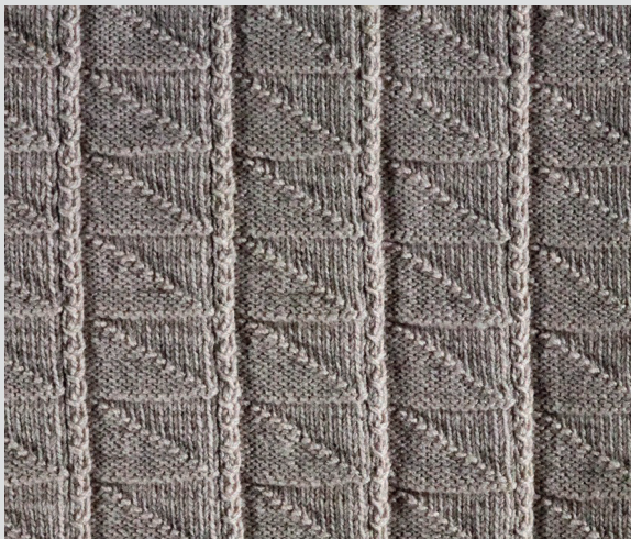
Узор «Уголки» и «ложные косы», Фрейзербург. Шотландский музей рыболовства, ANSFM 2019.374