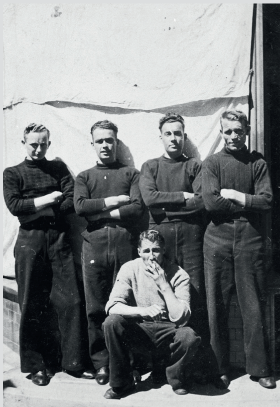
Групповое фото пяти питтенуимских моряков. Фото из архива Шотландского музея рыболовства, SFM_4567