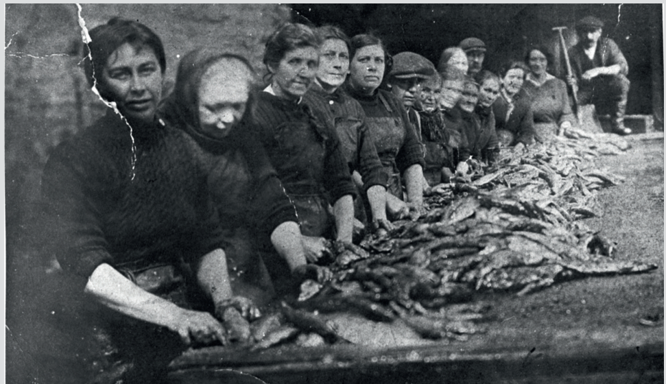
Заготовщицы сельди за работой во дворе дома Крейгов, Данбар, 1930-е, Шотландия. Фото из собрания Шотландского музея рыболовства, SFM_4075