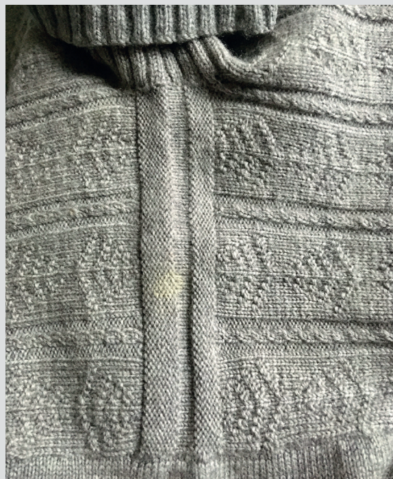
На гернсийском свитере с узором «дерево», связанным Беллой, хорошо видно плечевое соединение полосой-погоном.