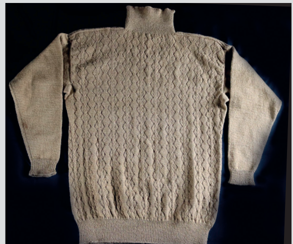
Узор с незавершенными (открытыми) «ромбами» и «ложный жгут» 2×2 п. Фрейзербург. Шотландский музей рыболовства, ANSFM2019.317