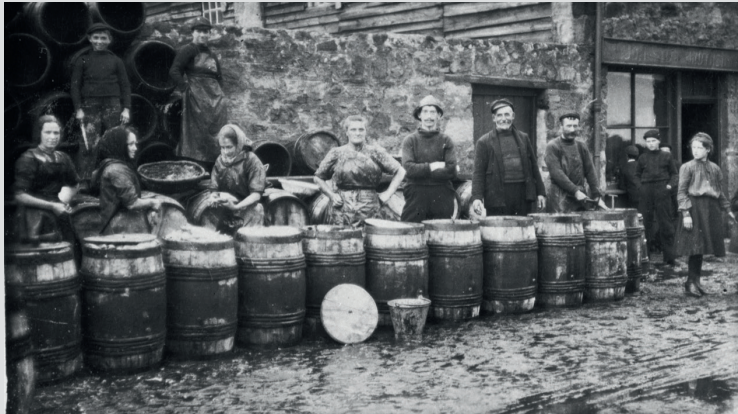
Промывка и засолка сельди. Анструтер, 1909 г. Фото из архива Шотландского музея рыболовства, SFM_1879