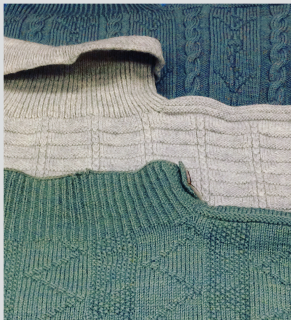
Гернсийские свитеры в традиционных цветах из коллекции Шотландского музея рыболовства.

Нам также удалось увидеть, как одна вязальщица попробовала провязать первый ряд узора из ромбов, а потом во втором ряду пыталась его скорректировать. Она явно