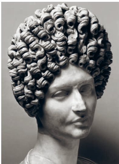
↑ ПОРТРЕТ РИМСКОЙ АРИСТОКРАТКИ С ПРИЧЕСКОЙ ПЕРИОДА ФЛАВИЕВ, ИЗВЕСТНЫЙ КАК «БЮСТ ФОНСЕКА». Кон. I — нач. II в. н.э.