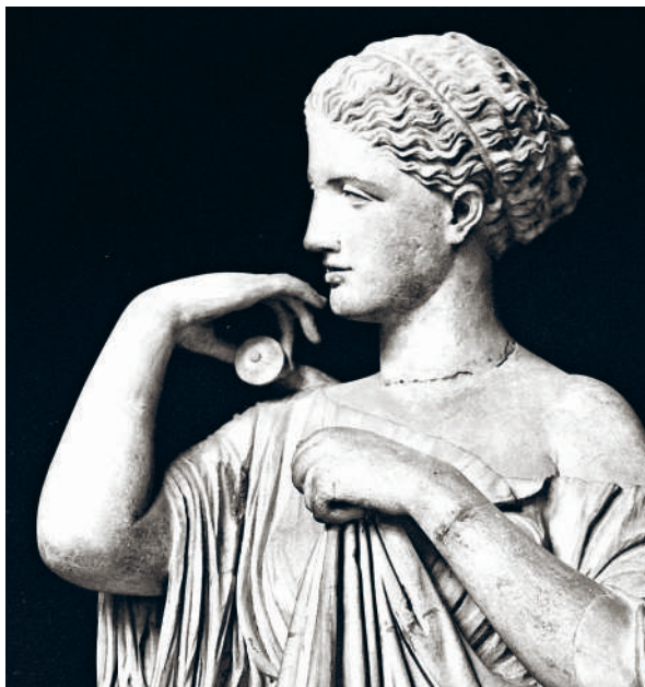
→ ПРАКСИТЕЛЬ. ДИАНА ГАБИЙСКАЯ. МРАМОР. IV в. до н.э. (ФРАГМЕНТ)

лица. Мода на бороды прошла с началом правления Александра Македонского, который гладко брил лицо.