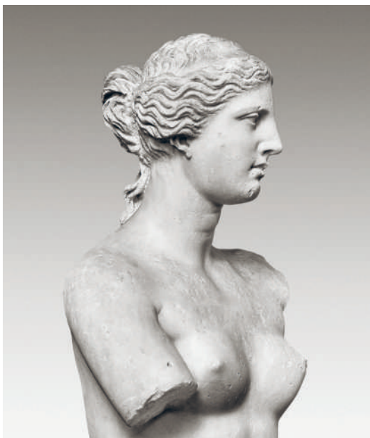
← «ВЕНЕРА МИЛОССКАЯ». МРАМОР. 150–125 гг. до н.э. (ФРАГМЕНТ)

В V–IV вв. до н.э. на смену косам пришли аккуратные парики из подстриженных, крупно завитых кудрей. Теперь силуэт головы обрисовывали четкие линии локонов. Парики были довольно однообразны, различались лишь виды завивки: она делалась горячим либо холодным способом, при этом техника исполнения все время совершенствовалась. Форме локона греки уделяли особое внимание,