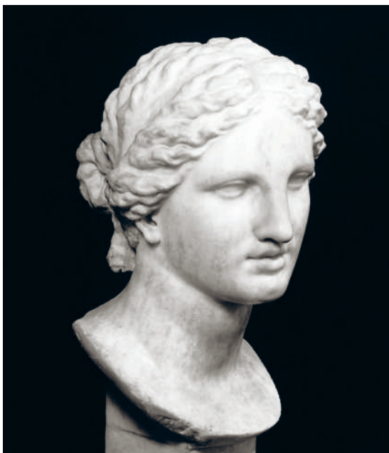
← ГОЛОВА АФРОДИТЫ

Во времена Римской республики (509–27 гг. до н.э.) преобладали простые и скромные прически, напоминавшие греческие. Одной из них был до сих пор сохранившийся и оставшийся популярным классический греческий узел. Волосы делили на прямой пробор и зачесывали по бокам назад, собирая в тугий узел, при этом лоб и уши