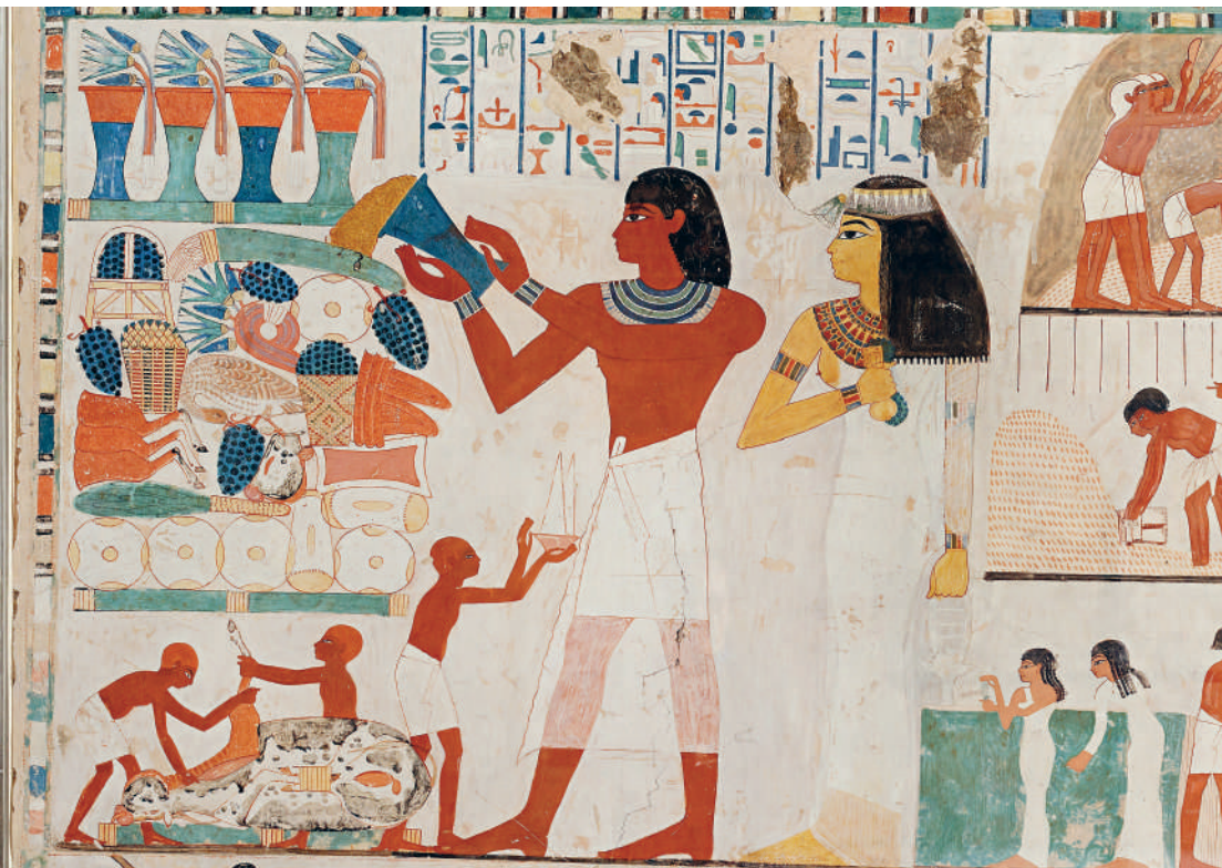
↑ ФРЕСКА С ИЗОБРАЖЕНИЕМ СЕЛЬСКОХОЗЯЙСТВЕННЫХ РАБОТ ИЗ ГРОБНИЦЫ НАХТА. 1400–1390 гг. до н.э.

египетской живописи: каноны древнего искусства предписывали этот цвет для изображения мужских фигур, а женщины (и рабы!) изображались с кожей желтого цвета.