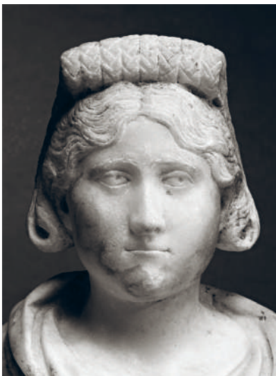
↑ ПОРТРЕТ АРИСТОКРАТКИ. МРАМОР. 270-280 гг. н.э.

располагали валиком надо лбом или укладывали на каркас в виде кокошника. Все эти сооружения требовали очень густой шевелюры, поэтому в ход пошли искусственные волосы, шиньоны и парики. Прически украшались диадемами, повязками, обручами различной ширины с фигурными шпильками. Кстати говоря, в те времена ни одна женщина не обходилась без шпилек. Они были двух видов — для распутывания волос и для их скрепления. Особенно любимы были шпильки с фигурными навершиями.