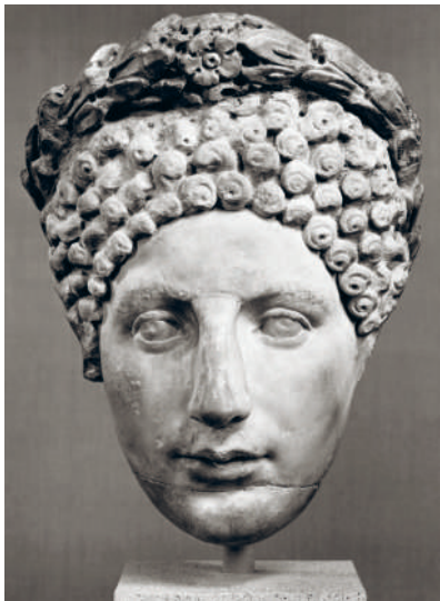
↑ ПОРТРЕТ РИМЛЯНКИ- АРИСТОКРАТКИ. МРАМОР. Кон. I в. н.э.