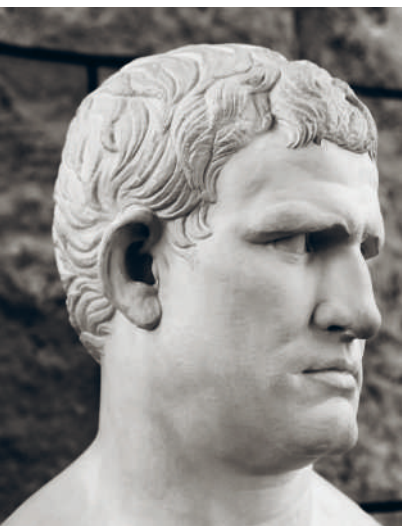
↑ ПОРТРЕТ МАРКА ВИПСАНИЯ АГРИППЫ. МРАМОР. Кон. I в. до н.э. — нач. I в. н.э.

Горячей завивкой волос занимались специально обученные рабы (тонсорес), затем за дело брались парикмахеры.