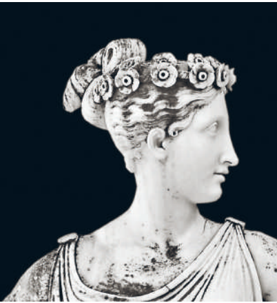
↑ ДРЕВНЕГРЕЧЕСКАЯ МУЗА ИЗ ДВОРЦА АХИЛЛЕОН НА ОСТРОВЕ КОРФУ. МРАМОР (ФРАГМЕНТ)

Считалось обязательным и в мужских, и в женских прическах скрывать линию роста волос, поэтому волосы делились продольным пробором и низко начесывались на лоб. Девушки носили распущенные волосы.