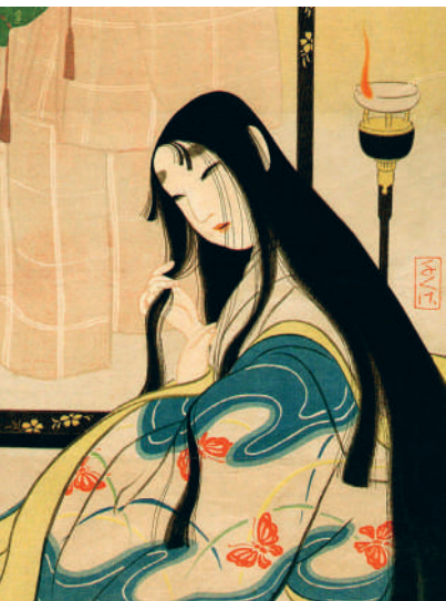
↑ ЧИГУСА КИТАНИ (1895–1947). ПРИДВОРНАЯ ДАМА ЭПОХИ ЭДЭЙАН. КСИЛОГРАФИЯ