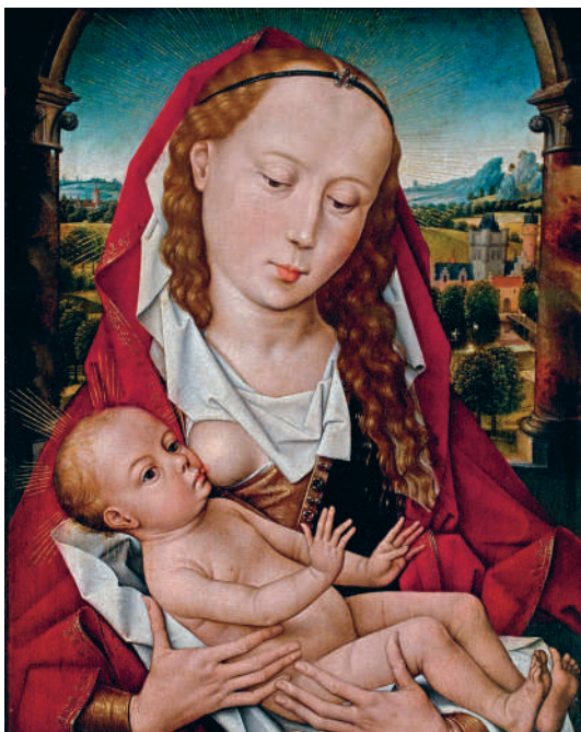
→ ГАНС МЕМЛИНГ. МАДОННА С МЛАДЕНЦЕМ. 1467 г.