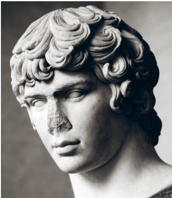
→ ПОРТРЕТ АНТИНОЯ. МРАМОР. Ок. 130-135 гг. н.э.

смесью масла из козьего молока и золы букового дерева, а затем выжигали цвет на солнце. Такие меры не добавляли здоровья волосам, но цель оправдывала средства.