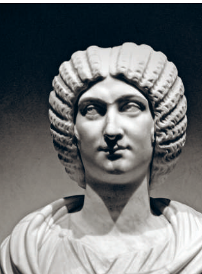
↑ ПОРТРЕТ РИМСКОЙ ИМПЕРАТРИЦЫ ЮЛИИ ДОМНЫ. МРАМОР. III в. н.э.