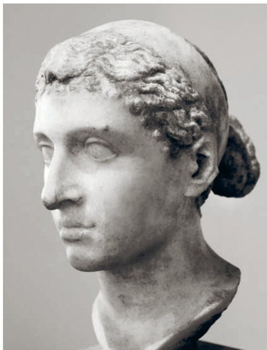
→ ПОРТРЕТ КЛЕОПАТРЫ VII. МРАМОР. 40–30 гг. до н.э.