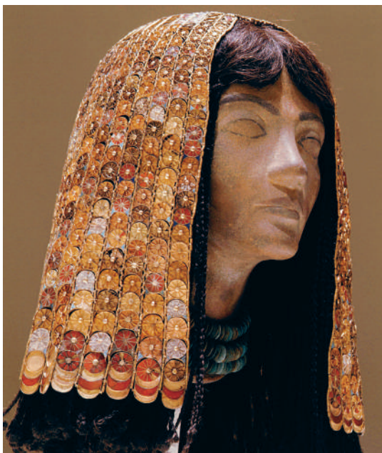
← ГОЛОВНОЙ УБОР ЖЕНЫ ФАРАОНА ТУТМОСА III. 1469–1436 гг. до н.э.

Египтяне были первыми специалистами в области косметики: это они придумали разнообразные краски, румяна, притирания, искусственные волосы, парики и многое другое. Во время раскопок в храме одной из цариц египетские археологи обнаружили целый косметический кабинет, где было все необходимое для придания привлекательности лицу и телу.