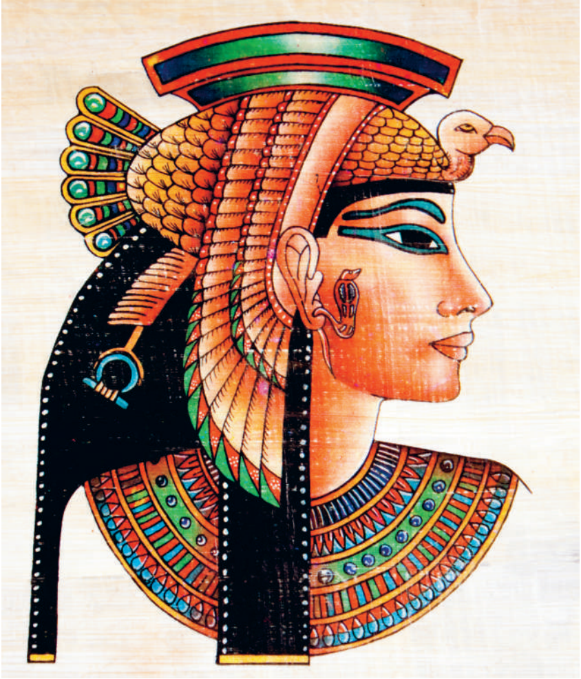
↑ ЕГИПЕТСКАЯ ЖИВОПИСЬ НА ПАПИРУСЕ