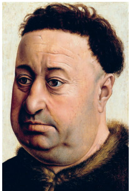
↑ РОБЕР КАМПЕН. ПОРТРЕТ ТОЛСТЯКА, ИЛИ ПОРТРЕТ РОБЕРТА ДЕ МАСМИНА. 1425 г.

В XV в. Жак де Ла Марш, известный проповедник-францисканец, одобрил употребление румян девицами на выданье, а также болезненными женщинами, желающими скрыть свои недуги. При этом в своих проповедях он утверждал, что увлечение средствами для украшения лица связано со сладострастием и развратом, а потому