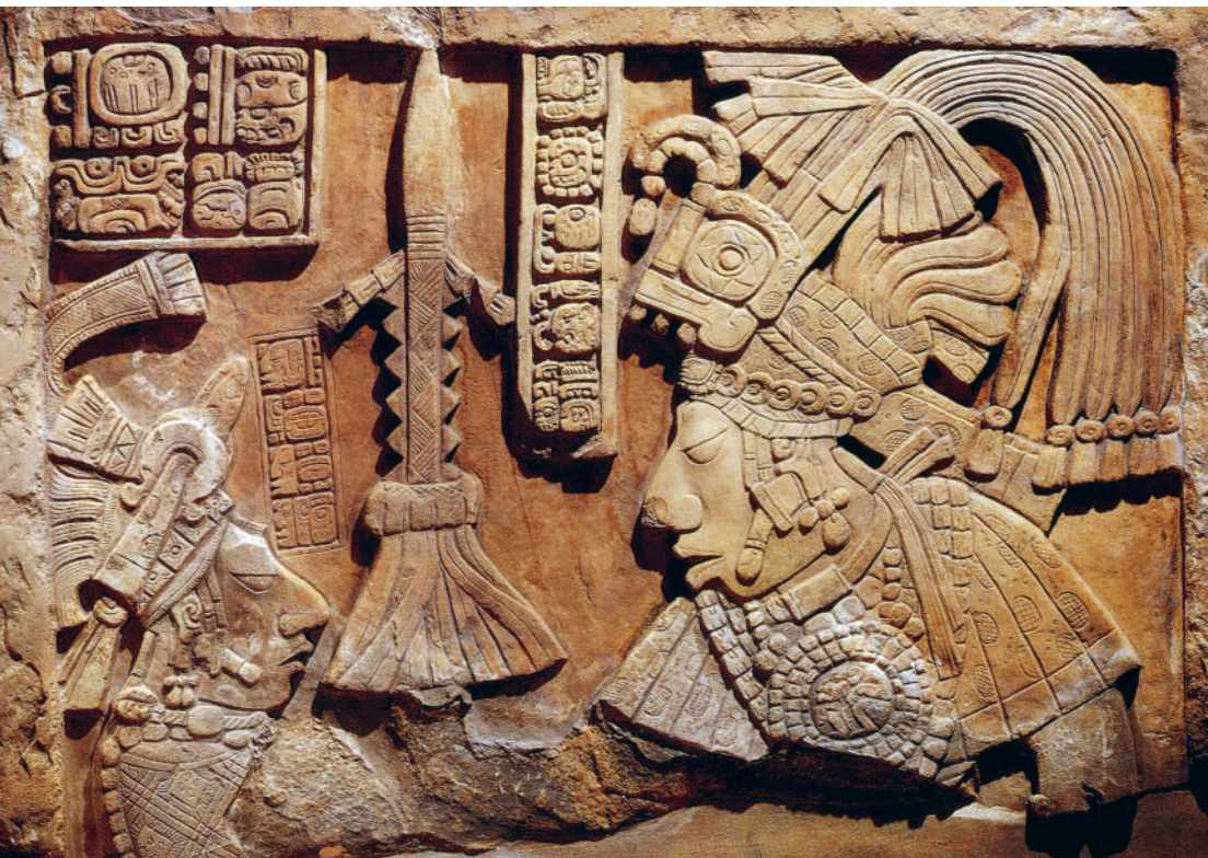
↑ ПРАВИТЕЛЬ ПАЧАНСКОГО ЦАРСТВА ЦИВИЛИЗАЦИИ МАЙЯ ЯШУН-БАЛАМ IV, ИЗВЕСТНЫЙ КАК ПТИЦА-ЯГУАР, И ЖЕНСКАЯ ФИГУРА, ОБА В ВОЕННОМ ОБЛАЧЕНИИ. РЕЗНОЙ ИЗВЕСТНЯКОВЫЙ БАРЕЛЬЕФ МАЙЯ В ЯКШИЛАНЕ, МЕКСИКА. Ок. 770 г. н.э.

Эталоном мужской красоты у майя были сплюснутый череп и крупный нос с горбинкой. К этим чертам можно добавить совершенно безбровое лицо, терракотовый оттенок кожи, черные волосы и необыкновенной красоты шрамирование — татуаж, наносившийся на лица и тела членов племени обоих полов.