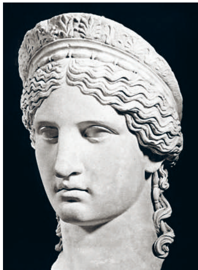
↑ ЮНОНА (ГЕРА) ЛУДОВИЗИ. МРАМОР. Перв. пол. I в. н.э.

оставались открытыми. Узел укладывали из гладких или волнистых волос, размещая выше или ниже затылка, украшали шпильками, затягивали золотыми или цветными сетками. Венчала эту красоту небольшая диадема.