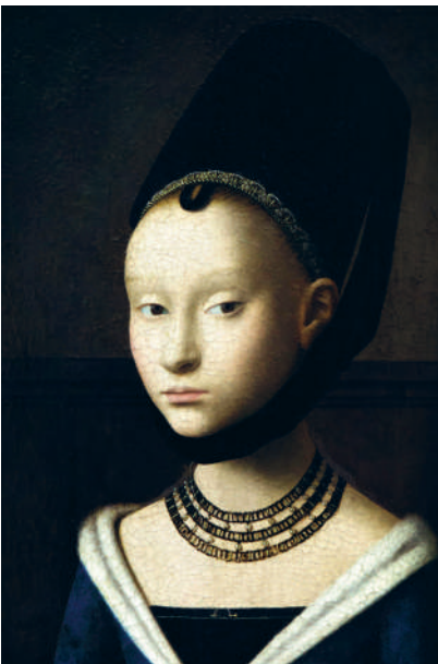
↑ ПЕТРУС КРИСТУС. ПОРТРЕТ ДЕВУШКИ. 1470 г.

были объявлены «нечестивым изобретением темных сил», превращающим женщину в пособницу дьявола. Проповедники учили верующих: «Красота — явление быстротечное, и попытки приукрасить будущий труп тщетны» 4 .