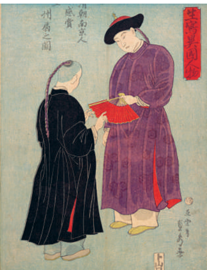
↑ УТАГАВА САДАХИДЭ. МУЖЧИНЫ ИЗ НАНКИНА ВРЕМЕН ДИНАСТИИ ЦИН ЛЮБУЮТСЯ ВЕЕРОМ

возраста девочкам туго пеленали стопы и грудь. Не соответствующую «стандарту» девушку было практически невозможно выдать замуж.