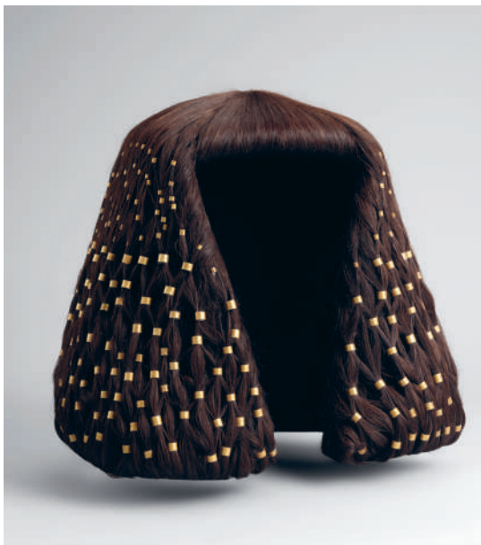
→ ПАРИК ИЗ ГРОБНИЦЫ ЕГИПЕТСКОЙ ПРИНЦЕССЫ СИТАТОРЮНЕТ. 1887–1813 гг. до н.э.

В берлинском Египетском музее хранится туалетный ящичек египетской царицы, пролежавший в земле почти 4000 лет, — возможно, он был одним из первых в мировой истории. В британском и берлинском музеях можно увидеть также элементы культуры Нового царства Древнего Египта: женские парики с длинными локонами из овечьей шерсти, зеркала, разнообразное украшения, шкатулочки и прочие женские безделушки.